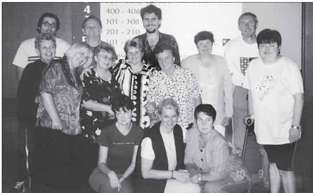
Členové Roska Kroměříž na rekondičním pobytu na Jelenovské.