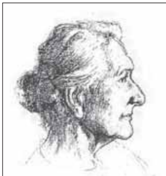
Portrét od V. Škrance