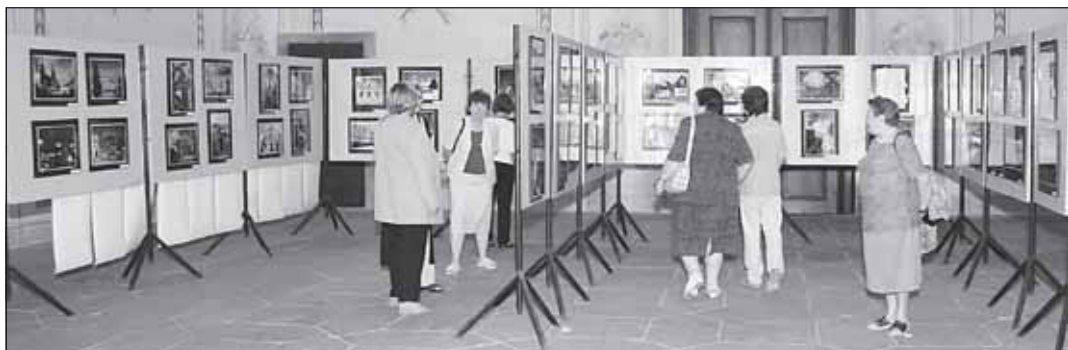
Vernisáž výstavy se konala 3. srpna v předsálí Sněmovního sálu Arcibiskupského zámku.

ny nezávislé publicistiky MEDIA IN Praha. Konala se pod patronací České komise pro UNESCO, města Kroměříže a Arcibiskupského zámku. Na panelech si mohli návštěvníci prohlédnout na 150 fotografií nejkrásnějších míst světa (i Kroměříže!) z 830 objektů, zapsaných na prestižním Seznamu světového kulturního a přírodního dědictví UNESCO. V tomto rozsahu se výstava letos pořádala pouze v Kroměříži a v Národní knihovně v Klementinu. -kam-