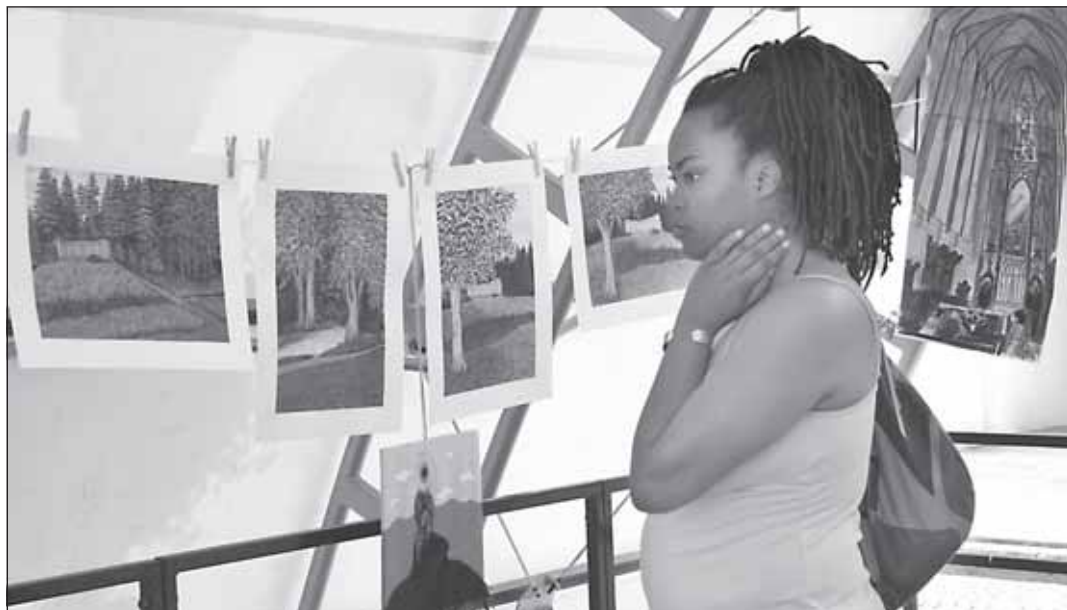
Improvizovanou galerii si se zájmem prohlédli i zahraniční návštěvníci města.