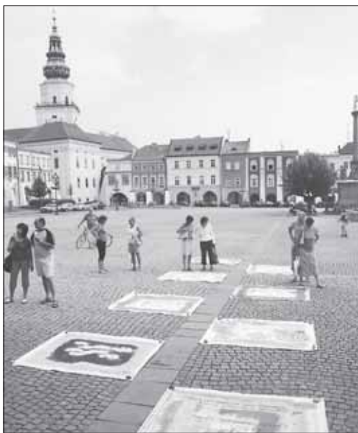
Své prožitky z každého dne v Kroměříži vložili účastníci tvořivé dílny do duhového deníku, jenž byl 29. července vystaven pod modrou oblohou na Velkém náměstí.