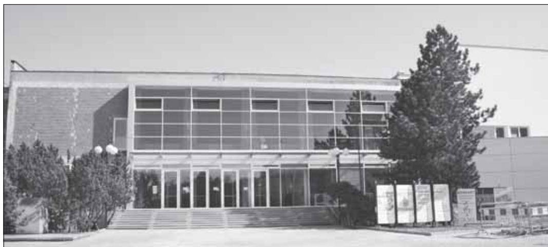
Ve dnech 17. a 18. května se do Domu kultury v Kroměříži vrací další, v pořadí čtrnáctý, ročník celostátního semináře Celoživotní učení – Kroměříž 2007.

Pro letošní ročník se stala hlavním námětem semináře dvě témata. Prvním z nich je Vzdělaný zaměstnanec coby konkurenční výhoda firmy. Čím dál více je zřejmé, že nestačí pouze sázka na dobrý management, na dobrý marketing nebo na moderní, respektive úsporné technologie. Vzdělaný a především průběžně vzdělaný zaměstnanec je nedílnou součástí prosperující ekonomiky. Ekonomiky znalostí a dovedností. Trvalý rozvoj lidských zdrojů je prvotním předpokladem pro udržení kontaktu s realitou a aktuálními trendy.