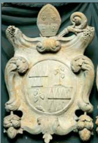
Znak Bruna ze Schauenburgu na velké drapérii nad vchodem do křestní kaple.