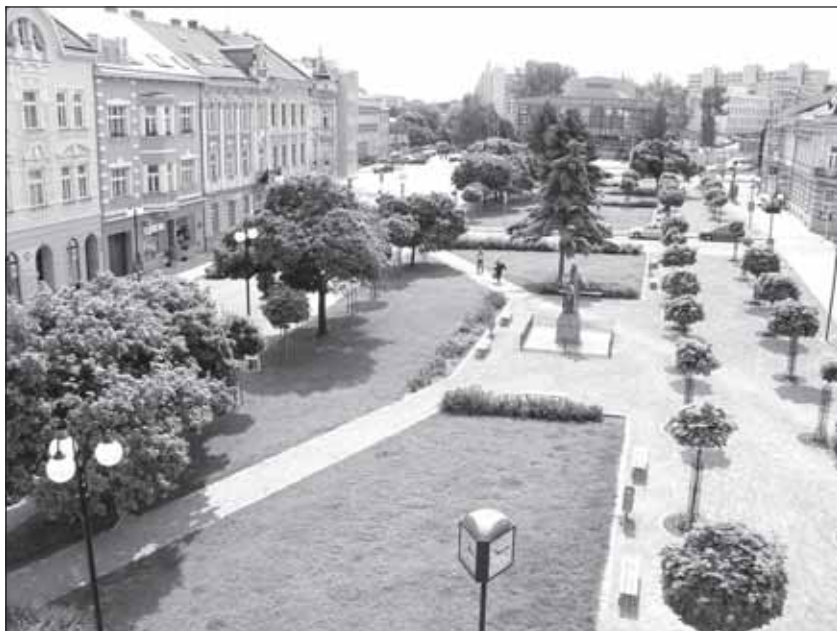
Dnes už historický snímek pořídil Miroslav Večerka.

Dlouho se zde pohřbívalo, až konečně křesťanský i židovský hřbitov znovu změnil své místo a „usadily“ se tam, kde je Bezručův park, židovský na místě ředitelství policie. V roce 1908 se Židovská obec kroměřížská rozhodla postavit novou modlitebnu - synagogu - za již nevyhovující v Moravcově ulici - Velké Židovně. Byla situována na jižní stranu náměstí. Plány budoucí stavby vypracoval vídeňský architekt Jakob Gartner. Po schvalovacím řízení byl 2. prosince 1908 položen základní kámen. Samotná stavba byla zahájena na jaře 1909. Práce byly zadány kroměřížské stavební firmě Ladislava Mesenského. Stavba pokračovala tak rychle, že již 27. června 1910 byla provedena kolaudace a 3. července byla slavnostně předána židovské obci. Ta modlitebnu v maurském slohu, důstojnou dominantu Komenského náměstí, užívala až do roku 1942. V tom roce byli kroměřížští Židé i s posledním zdejším rabinem dr. Jáchymem Astelem (nar. 1901 v Przemyslu, absolvent univerzity v Oxfordu, zahynul v Osvětimi) dne