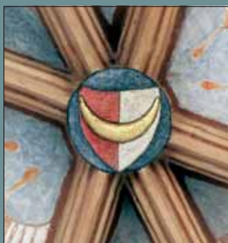
Znak Jana VII. Volka na svorníku v chrámu sv. Mořice.