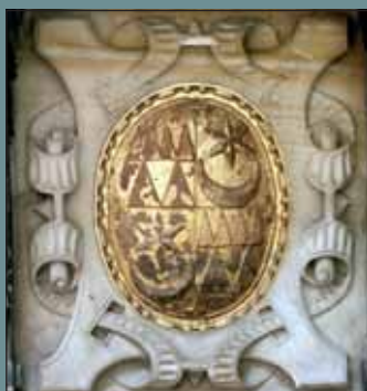
Znak St. Pavlovského na boku hlavního oltáře chrámu sv. Mořice.