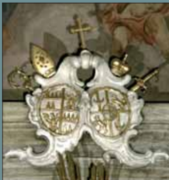
Znak LB. Egkha v kapli Bolesné P. Marie nad oltářem.