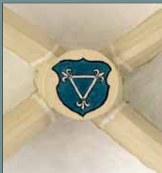
Znak Jana XIII. Dubravia na svorníku v chrámu sv. Mořice.