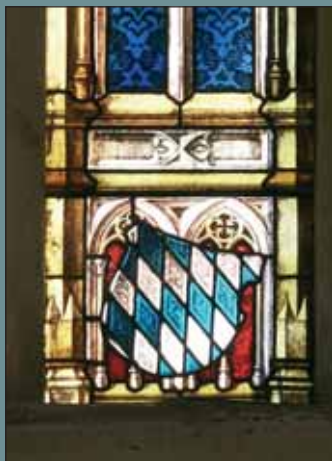
Znak Bavorska v chrámu sv. Mořice.