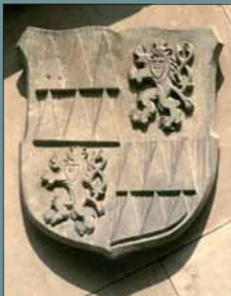
Znak olomouckého arcibiskupství na vnější stěně kaple Arcibiskupského gymnázia.