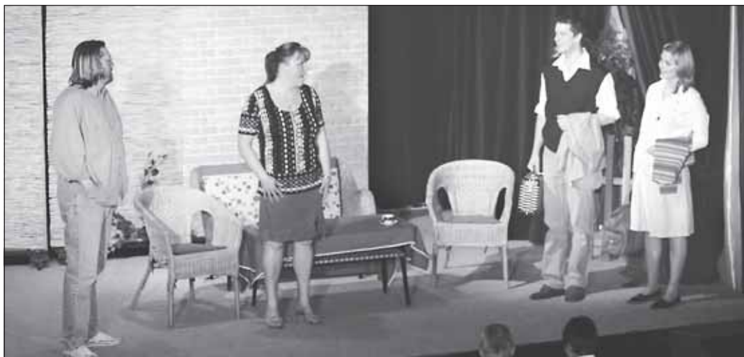
Čtyři aktéři komediální hry Aby bylo jasno si navzájem objasnili svoje pozice v příběhu až na konci představení.

Kroměřížští ochotníci představili v únoru a březnu tři úspěšné inscenace. Divadelní a loutkový soubor Sokola Kroměříž sehrál anglickou komedii Raye Cooneye 1 + 1 = 3 , Divadelní soubor Domu kultury Kroměříž hru anglického autora Alana Ayckbourna Aby bylo jasno a nově vzniklý Divadelní spolek Kroměříž uvedl jako svou první inscenaci hru chorvatského dramatika Miro Gavrana Vše o ženách . Úroveň všech představení svědčí o tom, že kroměřížští ochotníci svými výkony úspěšně navazují na zlatou éru dnes už seniorů ochotnického divadla, kteří s radostí sledují jejich úspěchy.