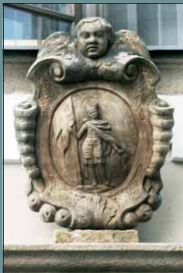
Znak kroměřížské kapituly sv. Mořice na domech v Jánské ul. č. 28, 29 a 30.