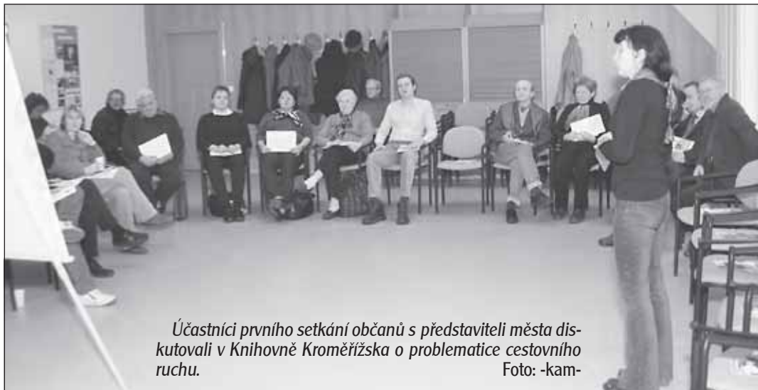
Účastníci prvního setkání občanů s představiteli města diskutovali v Knihovně Kroměřížska o problematice cestovního ruchu.