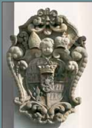
Znak K. Liechtensteina-Castelcorna na budově někdejší lékárny „U zlatého lva“ na Velkém náměstí č. 106.