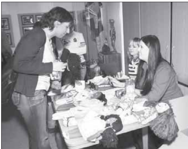
Výtěžek z prodeje textilních panenek pomůže ohroženým dětem v Africe.