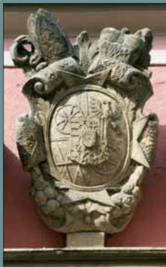
Znak Karla III. Lotrinského na kapitulní rezidenci v Jánské ul. č. 2.