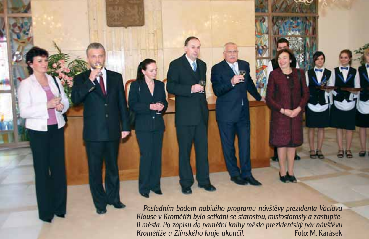
Posledním bodem nabitého programu návštěvy prezidenta Václava Klause v Kroměříži bylo setkání se starostou, místostarosty a zastupiteli města. Po zápisu do pamětní knihy města prezidentský pár návštěvu Kroměříže a Zlínského kraje ukončil.