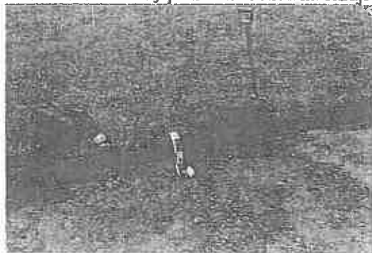
Obrázek 1. Celkový pohled na sondu na okraji manipulačního pásu.

B. Kontrola provedení skrývky v úsecích, kde je navržen ke skrývce i níže uložený horizont (spodní část humusového horizontu)