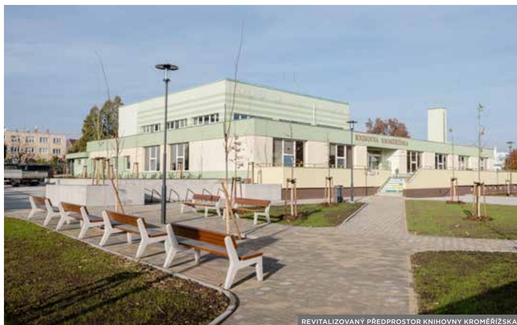
REVITALIZOVANÝ PŘEDPROSTOR KNIHOVNY KROMĚŘÍŽSKA

lionů na opravu vnějšího pláště krytého bazénu , více než 19 milionů Kč na stavbu cyklostezky Kroměříž - Miňůvky , přes 17 milionů na úpravu předprostoru Knihovny Kroměřížska , téměř deset milionů na zlepšení kybernetické bezpečnosti či asi osm milionů korun na nový informační varovný a vyrozumívací systém nebo na cyklostezku Kotojedy - Vážany . Po dlouhé době, minimálně po osmi letech,