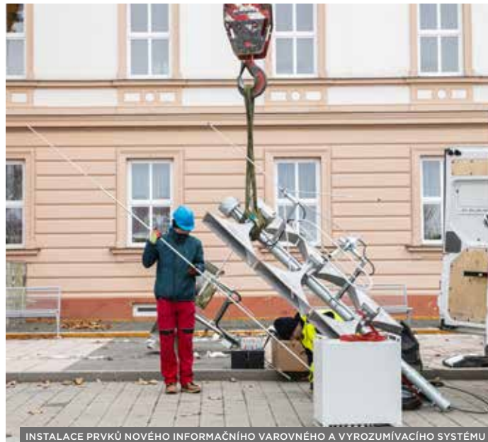
INSTALACE PRVKŮ NOVÉHO INFORMAČNÍHO VAROVNÉHO A VYROZUMÍVACÍHO SYSTÉMU

město získalo i dotaci na stavbu chodníků . Jednalo se chodníky v ulicích Obvodová a Lutopecká a o nový přechod pro chodce a přílehlý chodník v ulici Velehradská od Tesca ke hřbitovu, který vyřešil problém s přecházením frekventované silnice.