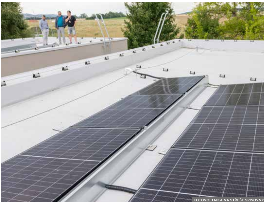
FOTOVOLTAIKA NA STŘEŠE SPISOVNY