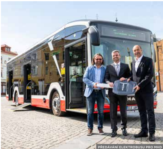
PŘEDÁVÁNÍ ELEKTROBUSU PRO MHD