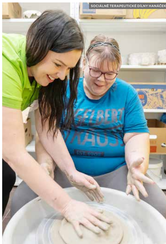
SOCIÁLNĚ TERAPEUTICKÉ DÍLNY HANÁČEK

Letos se městu také podařilo získat dotaci na podporu sociální práce pro dospělé , a to ve výši 8,9 milionu korun. Město tak díky čtyřem sociálním pracovnícům zajistí až do konce června 2028 dostupnější pomoc například nízkopříjmovým seniorům či samoživitelům a samoživitelkám. Jedná se v pořadí již o třetí návazný projekt s obdobným zaměřením. V současném volebním období tak město na tuto oblast obdrželo dotace v celkové výši téměř 19 milionů korun. (jv)