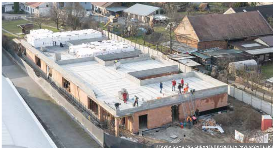
STAVBA DOMU PRO CHRÁNĚNÉ BYDLENÍ V PAVLÁKOVĚ ULICI

Od letošního roku mohou Kroměřížané využívat i službu domácí zdravotní péče, kterou provozují zdravotní sestry městem založené společnosti