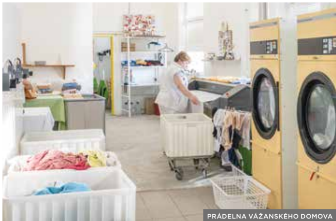
PRÁDELNA VÁŽANSKÉHO DOMOVA