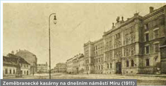
Zeměbranecké kasárny na dnešním náměstí Míru (1911)

Zlatý věk vojenských posádek našeho města začal s příchodem praporu pěšího pluku č. 3 arcivévody Karla, který byl na začátku roku 1857 dislokován z Uherského Hradiště. Přestože byli vojáci zpočátku ubytováni v domech zdejších měšťanů, postupně se z Kroměříže stalo významné posádkové město s několika kasárnami.