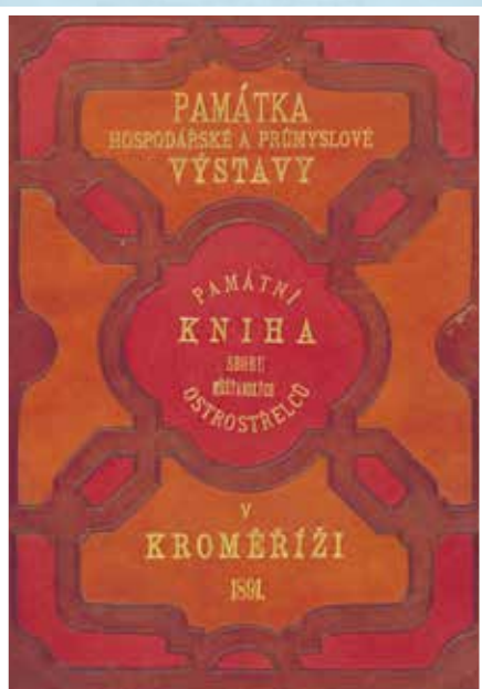
Přední deska pamětní knihy sboru ostrostřelců, která obsahuje popis výzbroje a výstroje a seznam členů v roce 1891.

(čerpáno z archivních pramenů, dobového tisku, publikací Historie sboru uniformovaných ostrostřelců v Kroměříži , Terče kroměřížských ostrostřelců a děl F. V. Peřinky ).