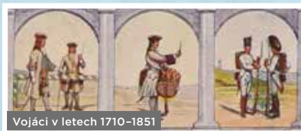
Vojáci v letech 1710–1851