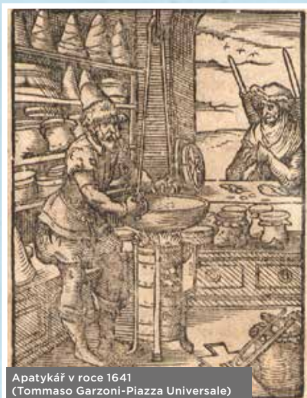
Apatykář v roce 1641 (Tommaso Garzoni-Piazza Universale)

O zdraví obyvatel města nepečovali pouze prostí ranhojiči, lazebníci nebo vzdělaní lékaři. Významnou roli v tehdejší společnosti zastávali také lékárníci zvaní apatykáři (apatyka či apotéka – lékárna). S touto profesí se setkáváme již ve středověku. Lékařny byly provozovány městy, soukromníky i církevními řády. Například na počátku 14. století se na Starém Městě pražském nacházely tři lékárny. Na konci 15. století tvořila vzorovou apatyku oficína, kam měl vstup povolen pouze personál a lékař