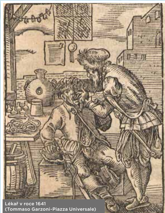
Lékař v roce 1641 (Tommaso Garzoni - Piazza Universale)

V období 16. a 17. století se již ve městech usazovali vystudovaní lékaři, v některých případech jako úřední lékaři (měštští fyzikové) placení městskou radou, podobně platily městské rady i úřední chirurgy či felčary nebo porodní báby. Vyskytovala