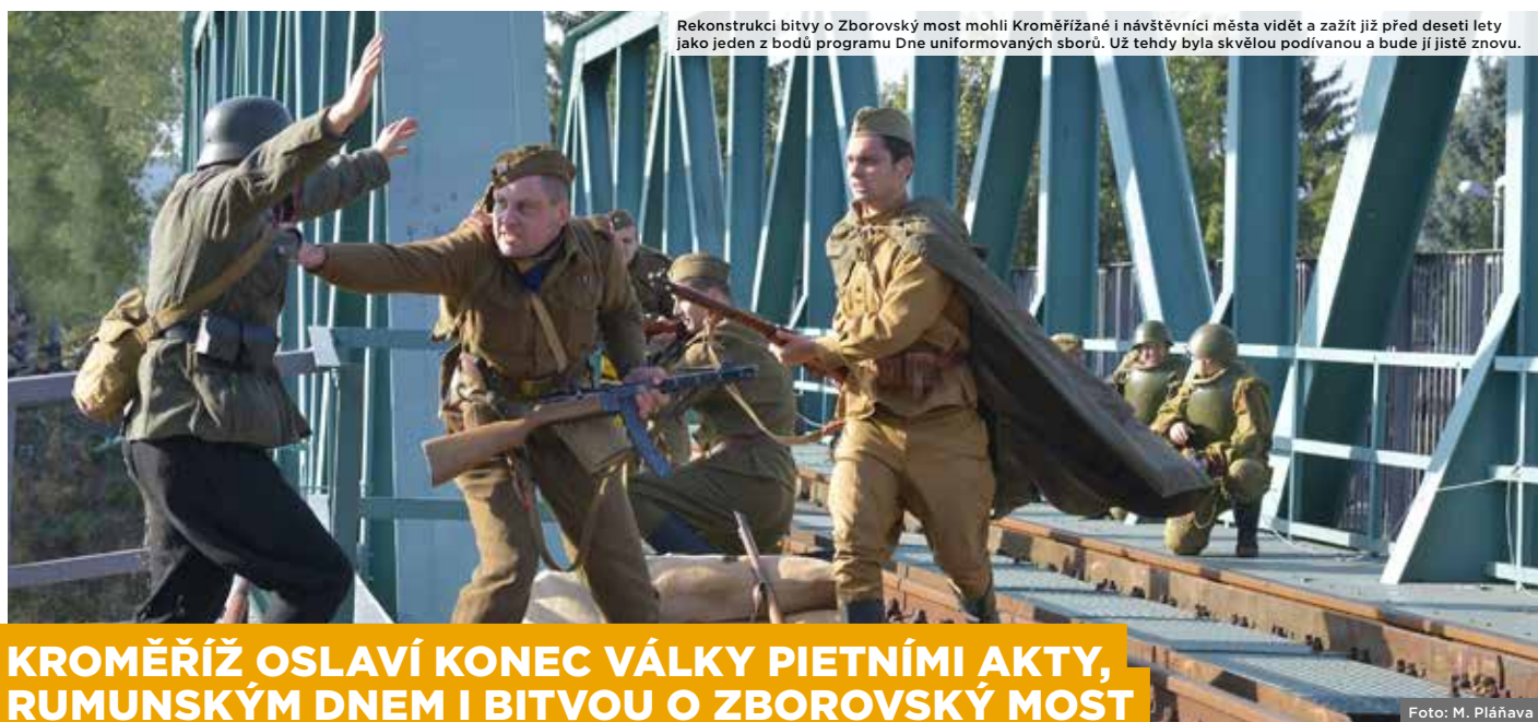
Rekonstrukci bitvy o Zborovský most mohli Kroměřížané i návštěvníci města vidět a zažít již před deseti lety jako jeden z bodů programu Dne uniformovaných sborů. Už tehdy byla skvělou podívanou a bude jí jistě znovu.