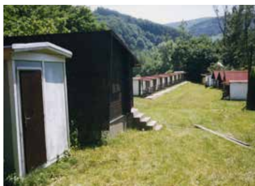
Areál tábora Pal-Magnetonu Kroměříž