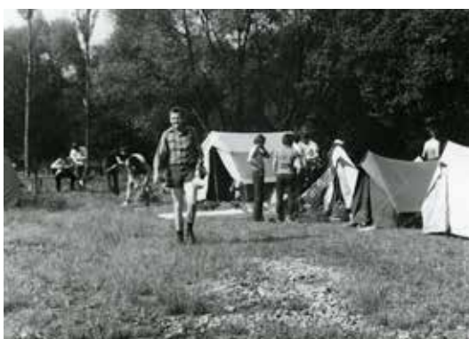
Turistický tábor, 1978