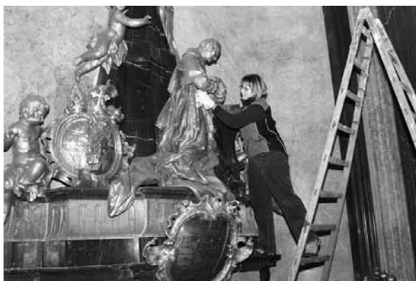
Na čtyřicet dobrovolných pracovníků provedlo generální úklid všech prostor chrámu sv. Mořice.