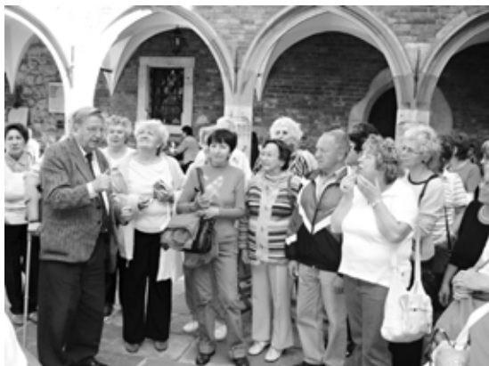
Z poznávacího zájezdu v Krakově.