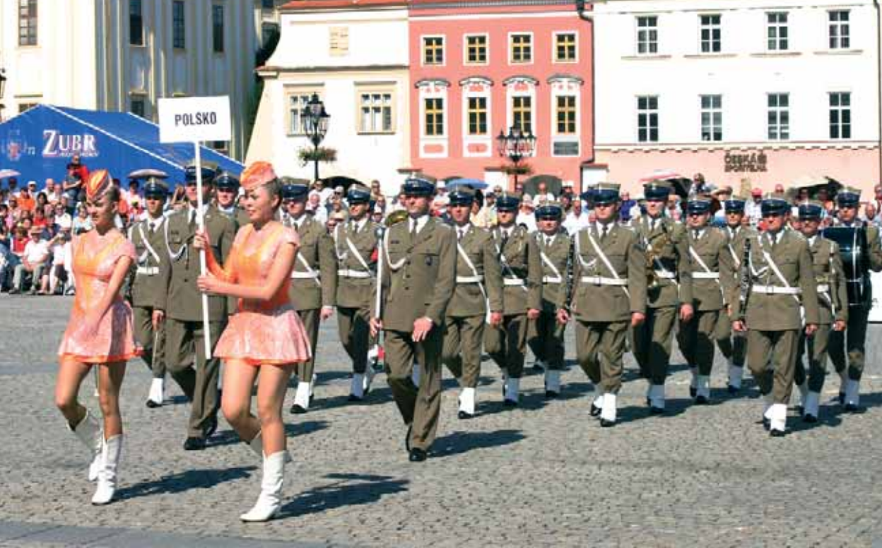
Mezinárodní festival vojenských hudeb Kroměříž 2008 obohatilo sedm armádních kapel ze šesti evropských zemí.

Foto na zadní straně obálky - letecký snímek generální opravy střechy zimního stadionu v Kroměříži. Pro Kroměřížský zpravodaj fotografoval Aleš Karban.