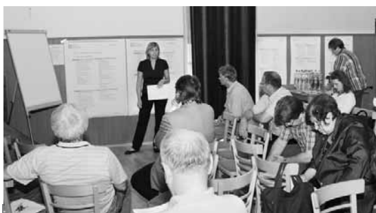
Účastníci shromáždění řeší aktualizaci strategického plánu rozvoje města.

Druhou aktivitou bude vzorová obnova vybraných částí Květné i Podzámecké zahrady. Zásadní proměnou projdou například vstupní objekt do Květné zahrady, plochy, které dnes nejsou přístupné, nacházejí se v zoufalém stavu a narušují harmonii celku, oba skleníky nebo zahradnictví v obou zahradách. Zejména zahradnictví musejí projít celkovou rekonstrukcí, aby do budoucna plnila roli garantů kvalitní údržby, která bude schopna