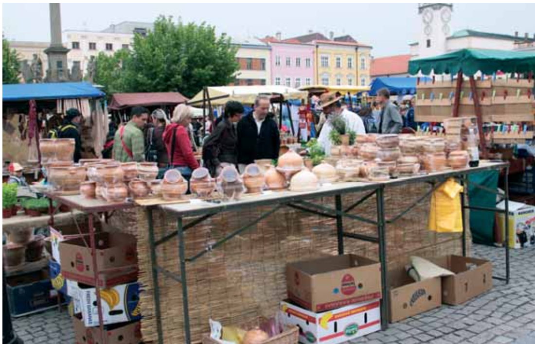
Jarmark nabídl tradiční řemeslné výrobky.