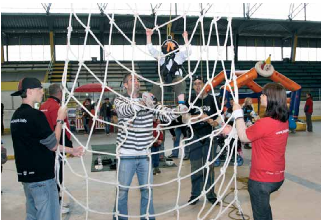
O atraktivní zábavu se postaralo o.s. JASPIS Kroměříž.