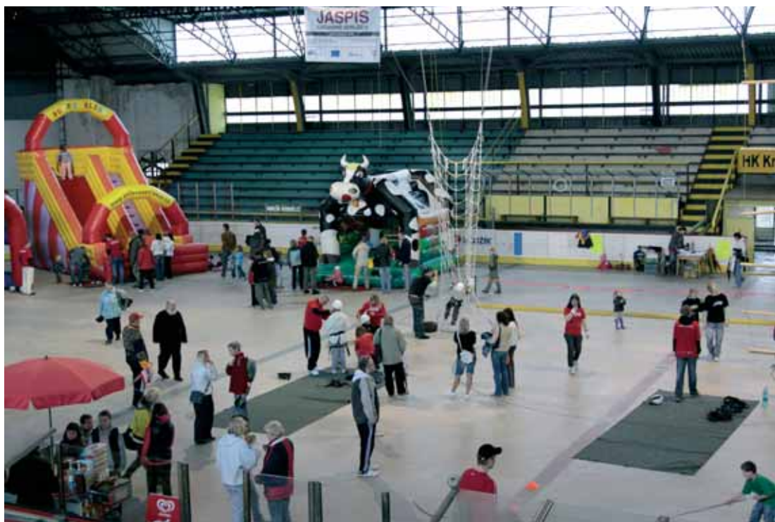
Den dětí se vinou deštivého počasí přesunul na zimní stadion.