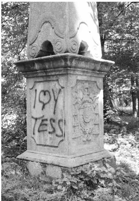
VANDALOVÉ ŘÁDÍ V PODZÁMECKÉ ZAHRADĚ

Deseti památkám v kroměřížském regionu pomohly v loňském roce peníze, které kroměřížské radnici poskytlo ministerstvo kultury v rámci nového dotačního programu Podpora obnovy kulturních památek prostřednictvím obcí s rozšířenou působností. Více než jeden a půl milionu korun na opravu památkových objektů se rozdělilo