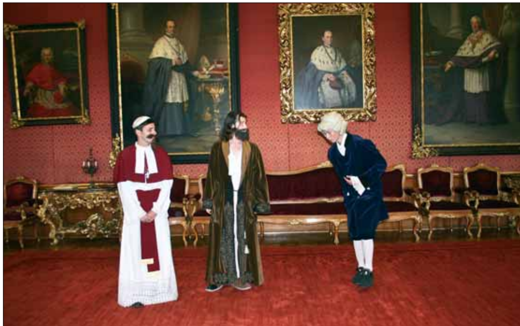
Prohlídku zámku oživila krátká představení. V jednom z nich se setkal kardinál František z Dietrichsteina s císařem Rudolfem II. a žádal ho o udělení mincovního práva pro kroměřížskou mincovnu. Žádosti bylo vyhověno.