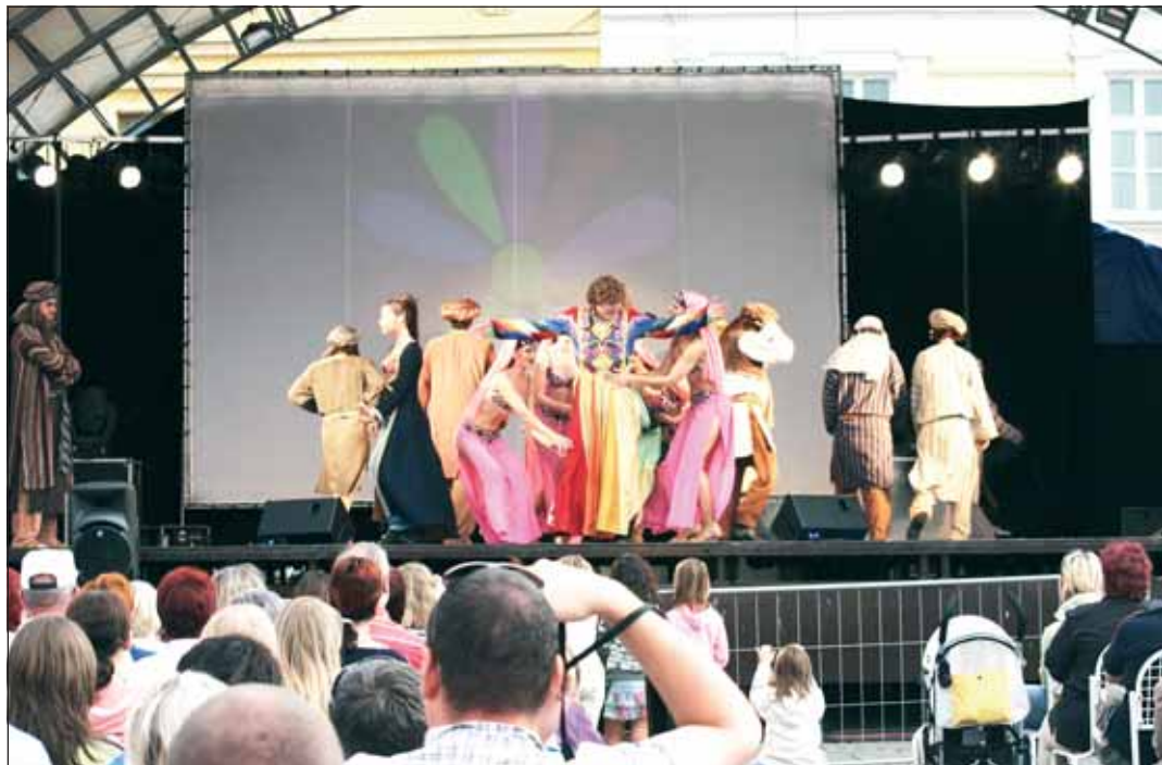
Muzikál Josef a jeho úžasný pestrobarevný plášť představilo na Velkém náměstí Městské divadlo Brno.