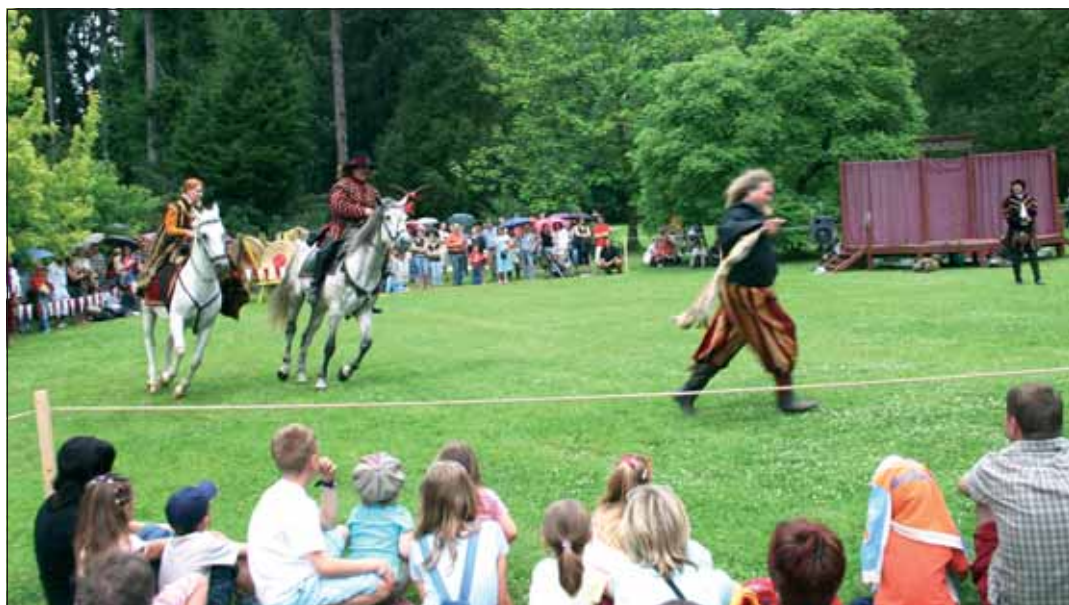
V Podzámecké zahradě bavili diváky šermíři, lovci, loutkoherci a jiní umělci.