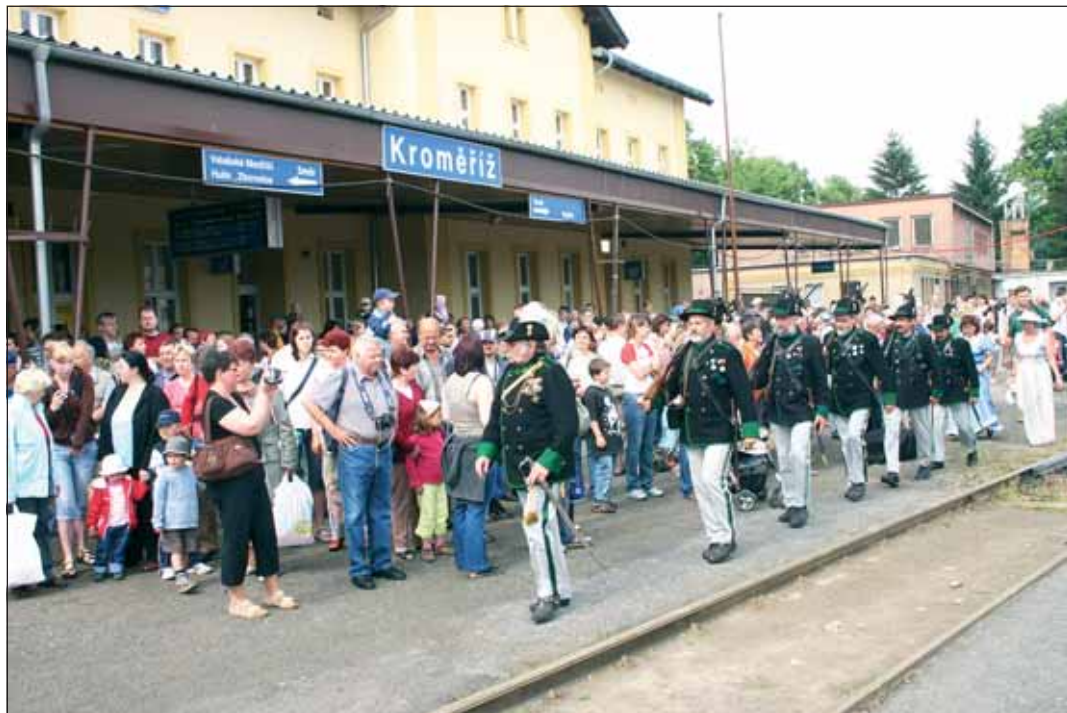
Čestná rota ostrořelců přichází. Obřad může začít. Zaměstnanci nádraží jsou ve slavnostních uniformách.