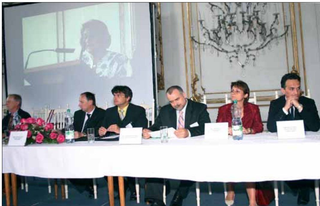
Mezinárodní konference, již pořádal mimo jiné Klub UNESCO Kroměříž u příležitosti 10. výročí zápisu zahrad a zámku na Listinu světového kulturního a přírodního dědictví UNESCO, se zabývala ohrožením historických zahrad.