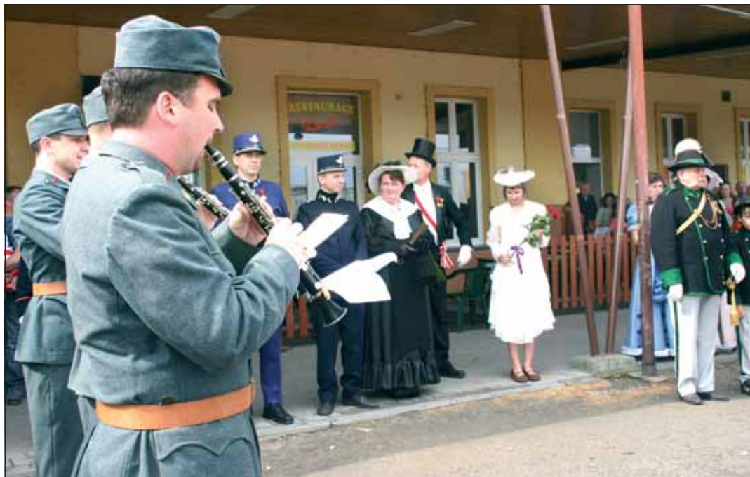
Kroměřížské nádraží ČD někdy v roce 1908 se připravuje na příjezd vzácné návštěvy. Vojenská hudba spustila Radeckého pochod, starosta naposledy kontroluje, zda jsou všichni na svém místě.