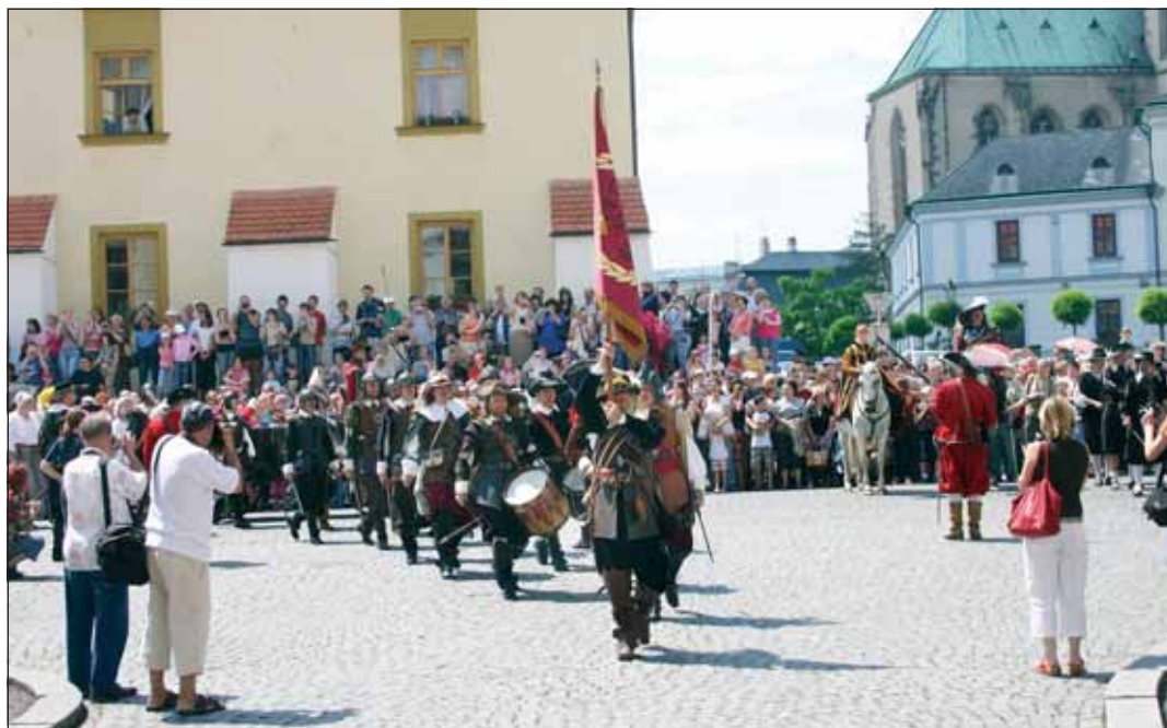
Na Sněmovní náměstí před Arcibiskupský zámek přijíždí kardinál František z Dietrichsteina s četným doprovodem.