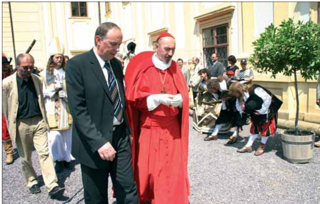
Se starostou města a v doprovodu hostů odchází do Arcibiskupského zámku.