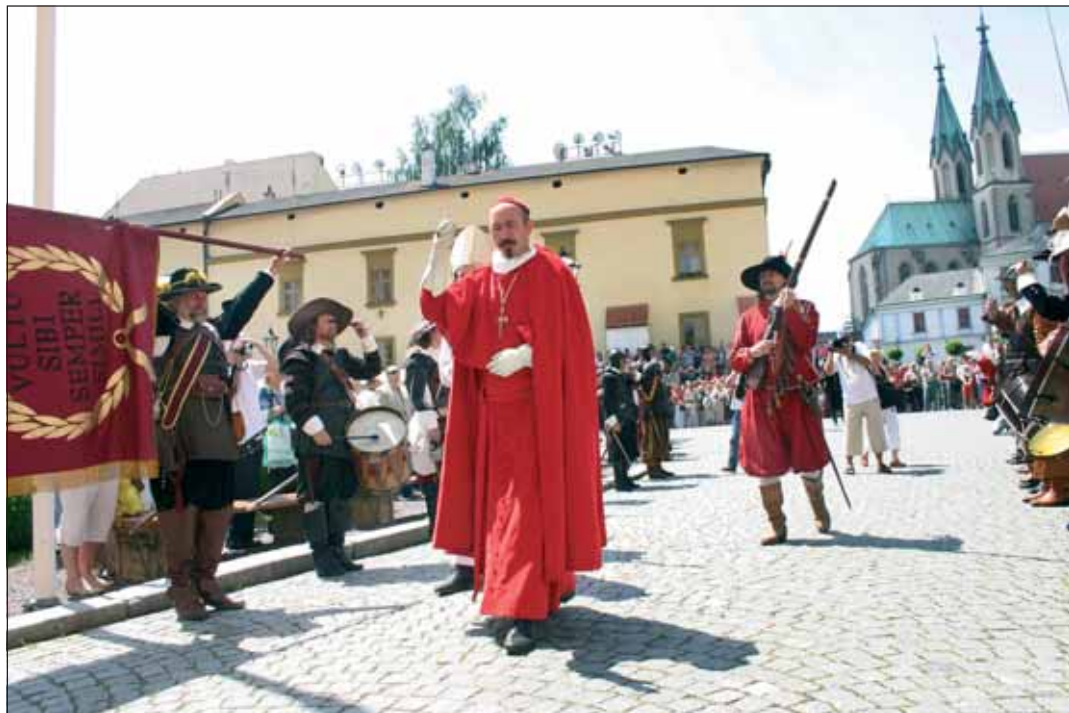
Kardinál odpovídá na provolávání slávy. Usedá na trůn, přijímá hosty a supliky poddaných řemeslníků.