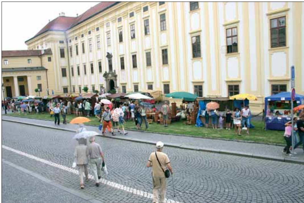
Knížecí holdování doplnilo před areálem zámku tržiště s výrobky řemesníků nebo různými dobrotami.