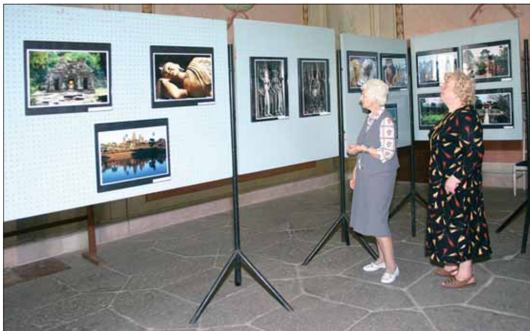
V předsálí Sněmovního sálu je k vidění výstava fotografií zajímavých míst, která figurují na seznamu UNESCO.