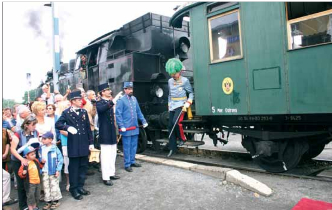
Ostrostřelci vypálili ze svých pušek předovek čestnou salvu. Arcivévoda František Ferdinand d' Este s chotí a synem vystupují z vlaku.