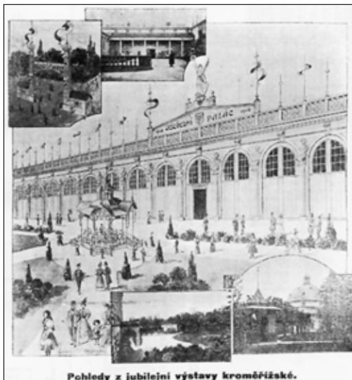
Pohledy z jubilejní výstavy kroměřížské.