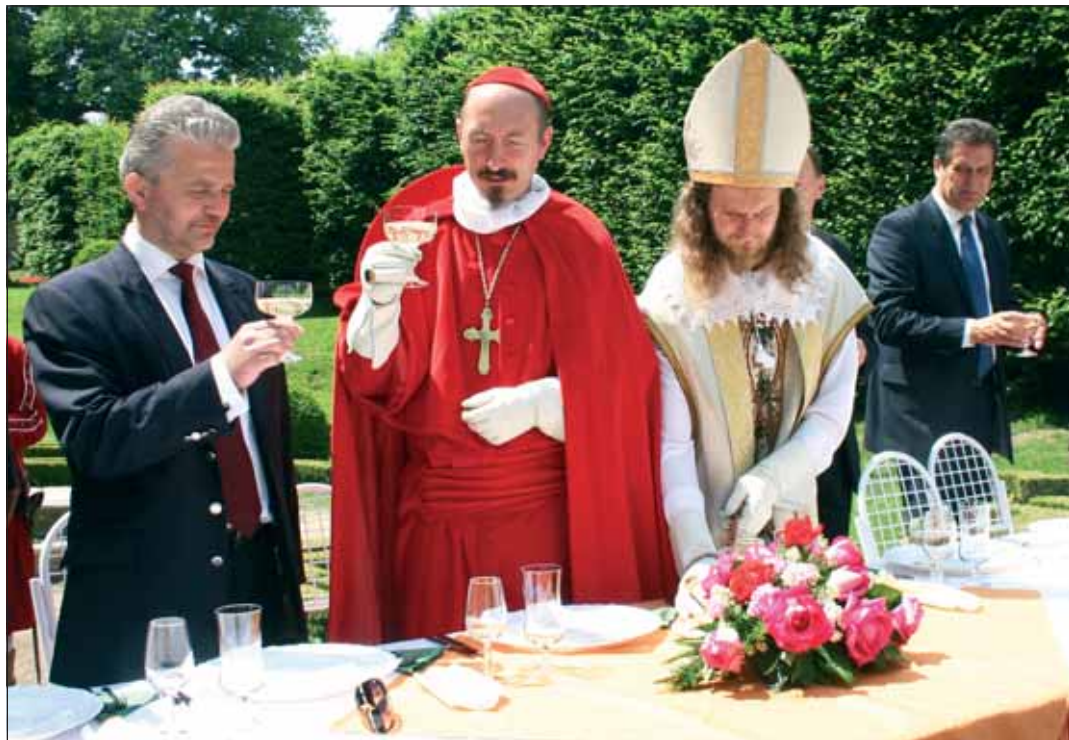
V Colloredově kolonádě čeká kardinála a jeho družinu malé pohoštění.