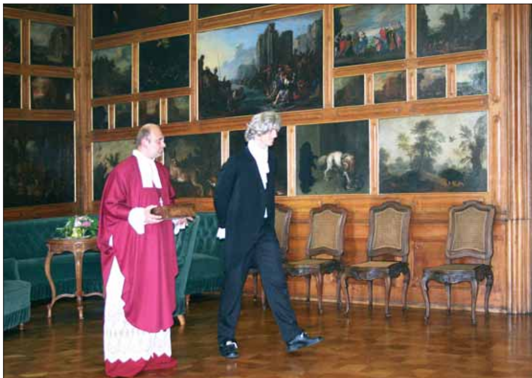
V Trůnním sále navštívil arcibiskupa Rudolfa Jana hudební génius a osobní přítel Ludwig van Beethoven.