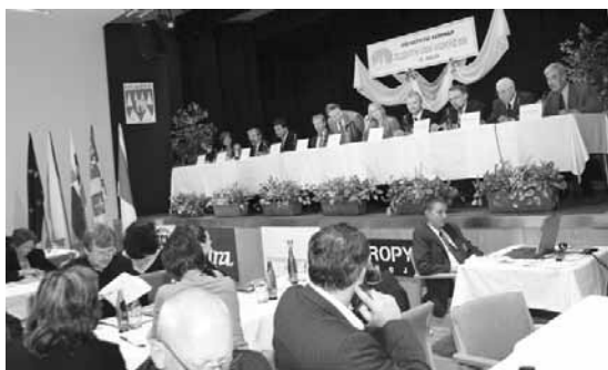
Snímek z loňského semináře v Domě kultury.

„Realizace strategií celoživotního učení ve firmách, vzdělávacích institucích a úřadech práce.“