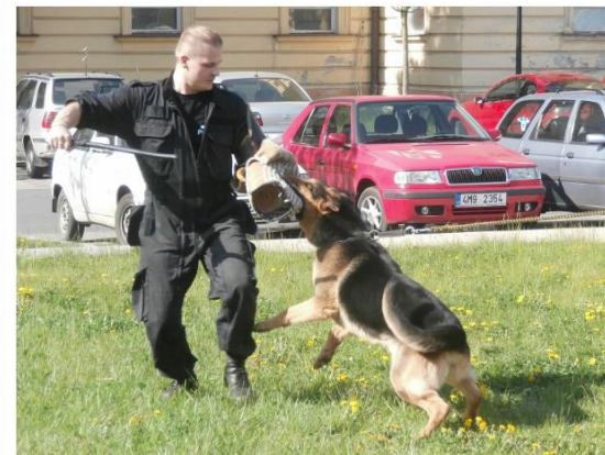
Všichni přítomní také zhlédli zajímavou ukázkou výcviku policejních psů od klasických povelů až po střílení a zadrženi pachtatele.

V sobotu 25. dubna se na Hanáckém náměstí pořádala akce s názvem Šťastný život Organizátorem bylo Mateřské centrum Klubičko v Kroměříži.