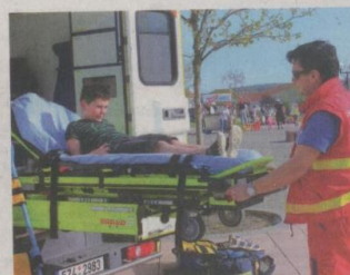
ZÁCHRANÁŘI. Lidé si mohli prohlédnout, jak třeba vypadá vybavení záchranné služby.

Doprovodný program zajistili dobrovolníci z Kroměříže, u kterých si děti mohly prohlédnout hasičský vůz nebo si vyzkoušet střikání z