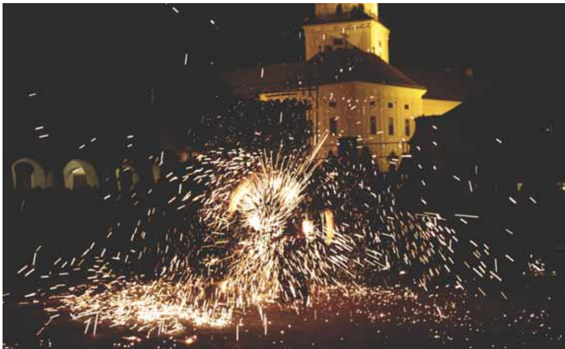
Ohnivou tečku za pátečním večerem vytvořila skupina Palitchi, která zkontrolovala oheň.