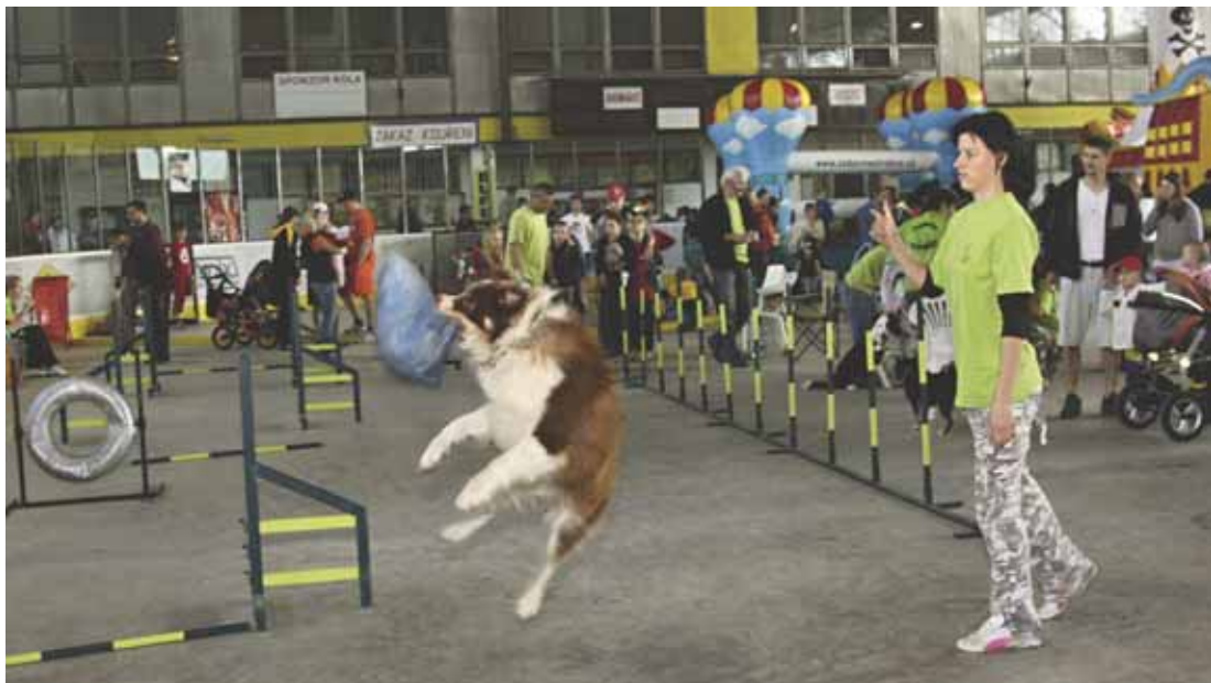
Po celé dopoledne bylo teritorium Agility Kroměříž stále v obležení milovníky čtyřnohých přátel.