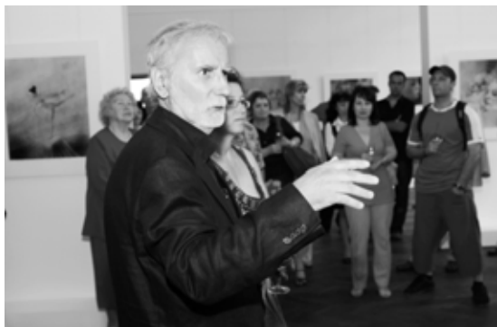
Vernisáže v Galerii Orlovna se 7. června zúčastnil i autor snímků Vladimír Židlický.