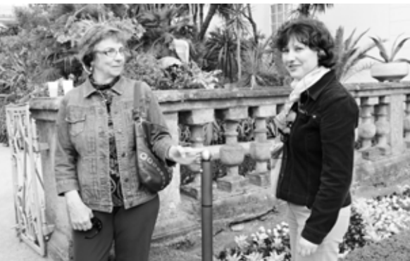
Výhody informačního systému si vyzkoušeli první návštěvníci.