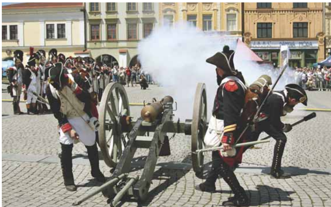
Výstřel z kanónu vystrašil holuby a probudil několik alarmů nedaleko parkujících aut.