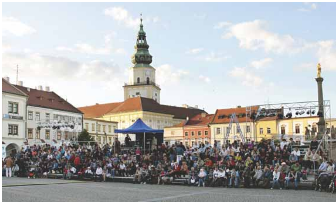
Zcela zaplněné hlediště na divadelním představení na Velkém náměstí.