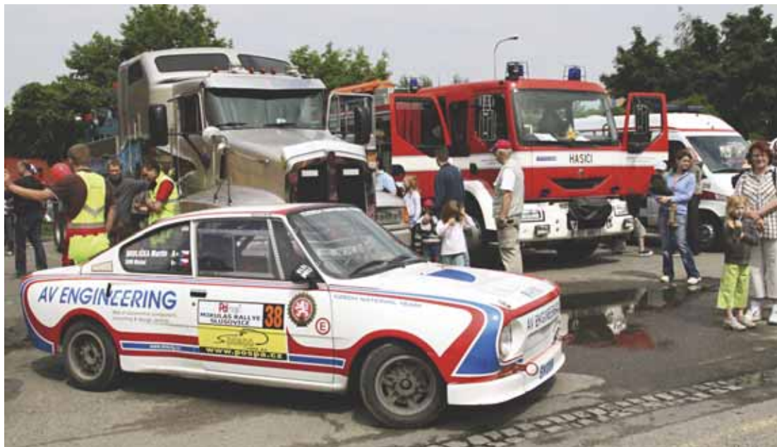
Auta různých účelů přilákala především mužskou část publika.