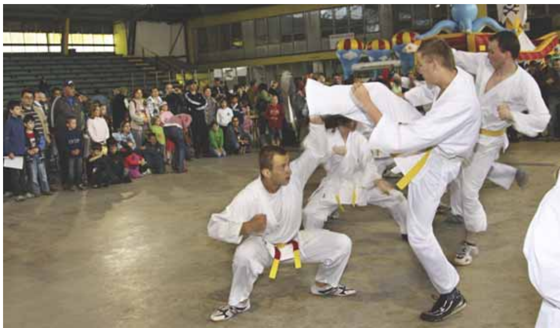
...a ukázky náročné přípravy karatistů.