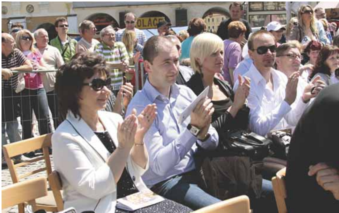
Velkolepého představení se zúčastnila i delegace z partnerského města Nitra.