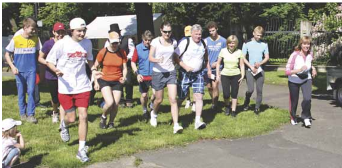
Sice neměli v patách nekompromisní c. a k. policii se zatykačem, ale i tak svižně vyběhlo 15 „poslanců“ tak, jak stihli opustit lavice Sněmovního sálu, po Hulínské ulici k nejbližšímu nádraží.