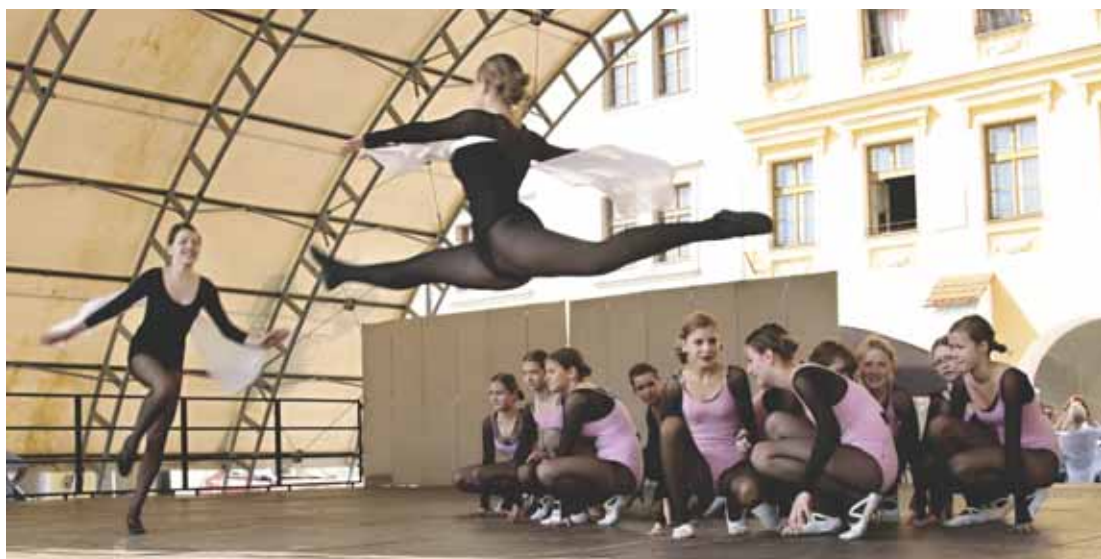
Balet Základní umělecké školy Kroměříž.