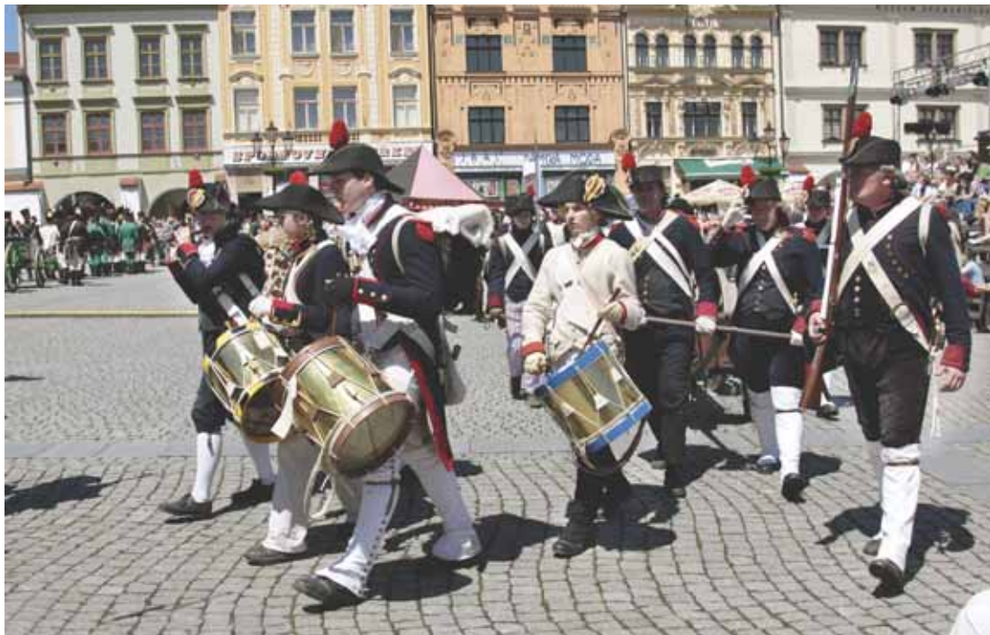
Sobota dopoledne, Velké náměstí – armády několika zemí opustily tábořiště a nastupují ke slavnostnímu pochodu.