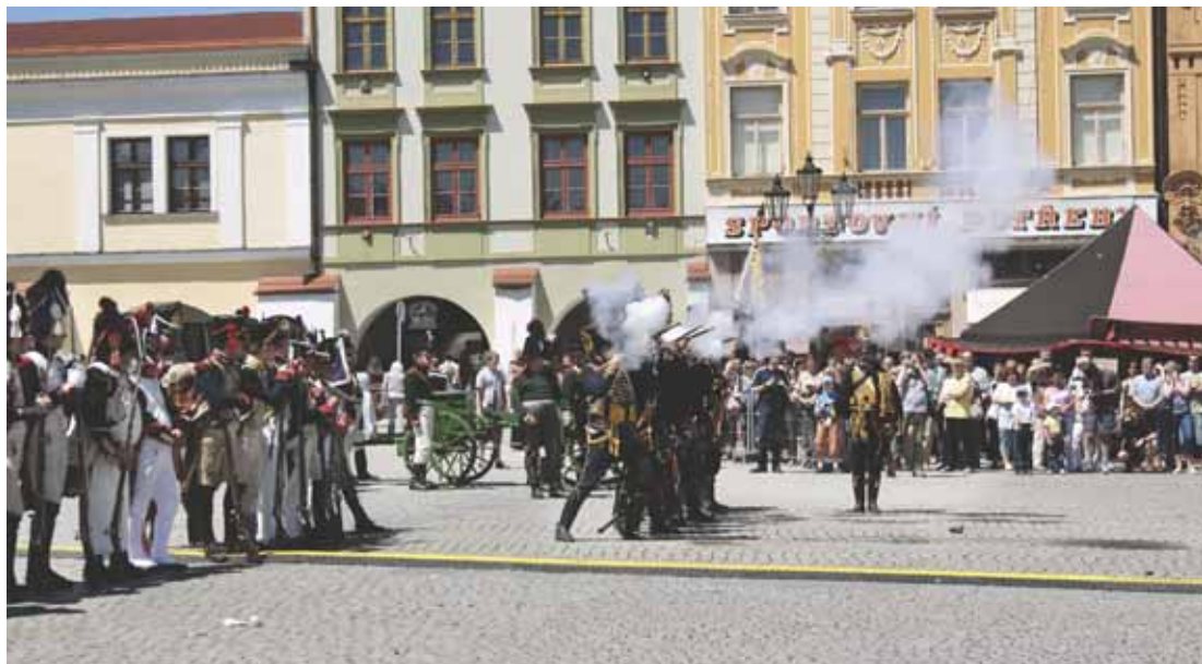
Salvy z pěchotních zbraní naznačily, jak asi vypadaly boje v 18. a 19. století.