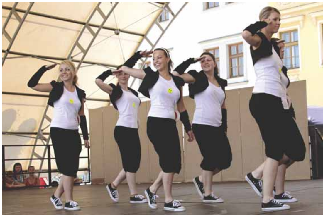
Policejní akademie – SVČ Šipka Kroměříž.