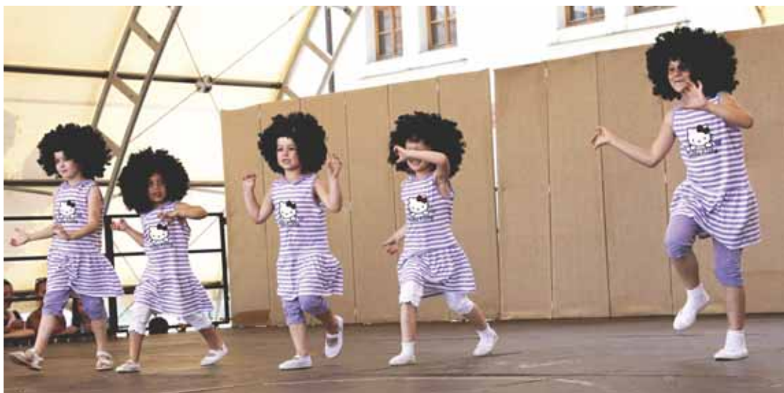
Africké děti – Dance Power