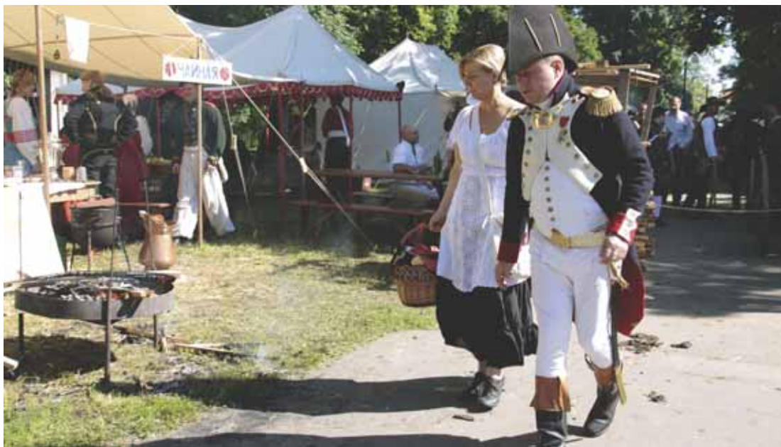
Sobota ráno ve vojenském ležení na Vejvanovského ulici.