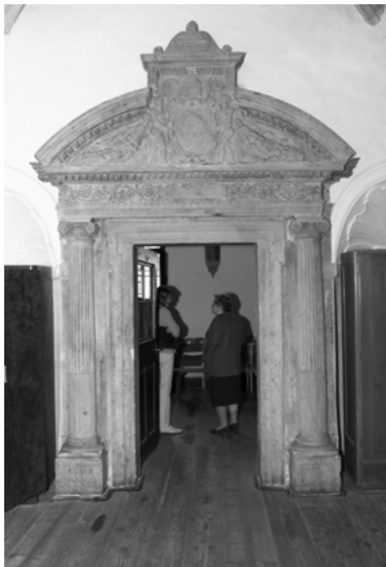
Vzácný portál v sakristii kostela sv. Mořice, datovaný MDLXXXII.