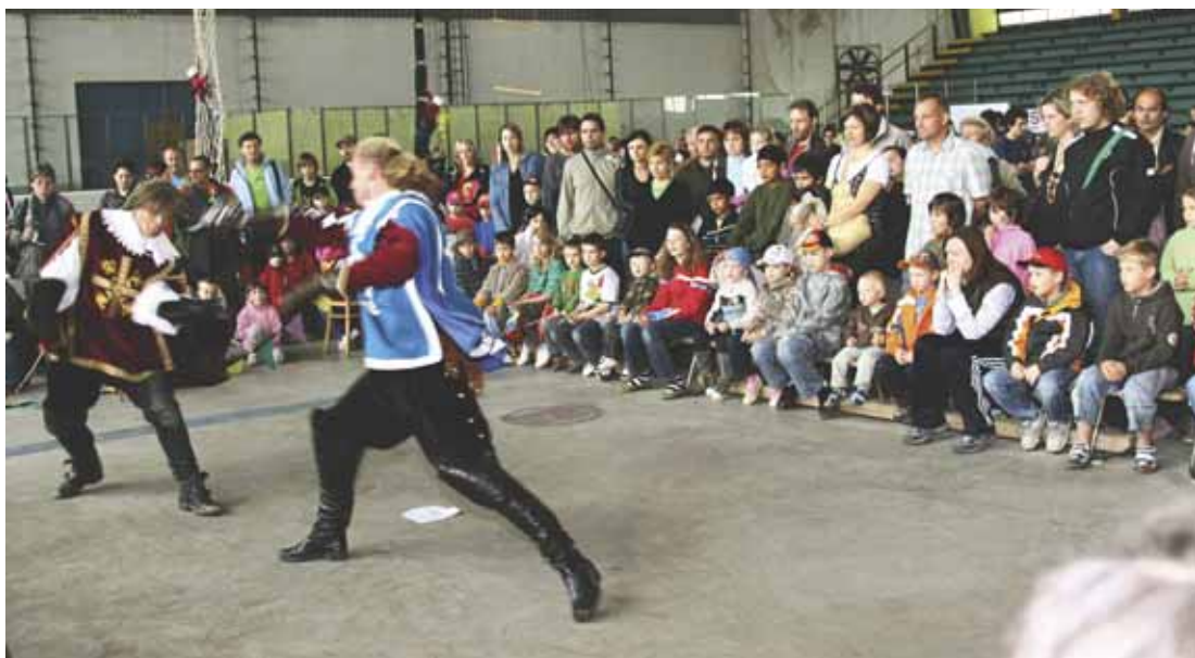
Brněnští Štvanci předvedli šermířské souboje mušketýrů o srdce krásné dámy. Prostě romantika.