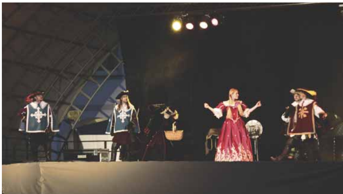
O náklonnost dam se usilovalo v každé době. Nejednou přitom tekla krev.