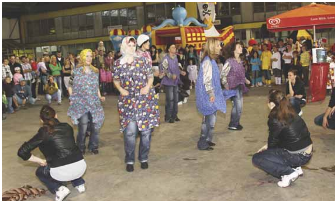
Náladu zpestřilo vystoupení taneční skupiny Dance Power.