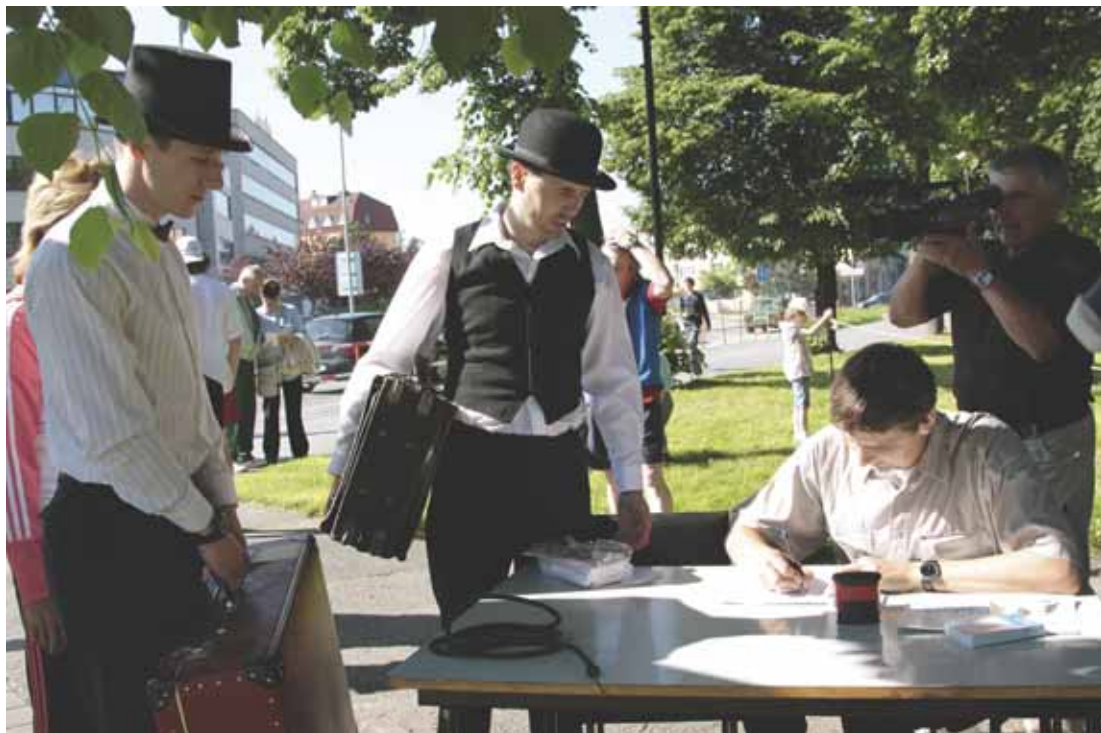
Zápis na startovní listinu účastníků poslaneckého běhu do Hulína – vlakové nádraží.