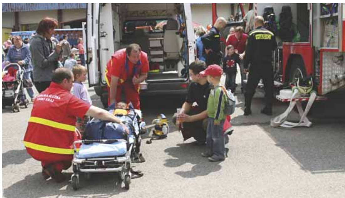
Dennodenně ve všech možných i nemožných situacích zachraňují to nejcennější – lidské zdraví a lidské životy.