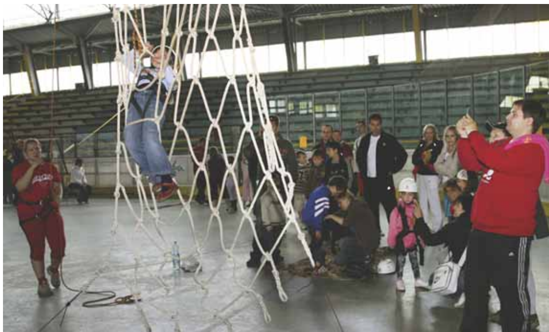
Lanové centrum klubu JASPIS Kroměříž potrápilo hodně odvážlivců.