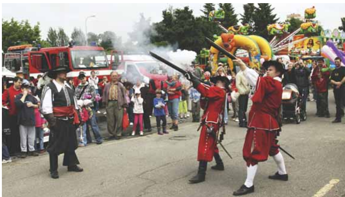
Salva z mušket v podání Biskupských manů.