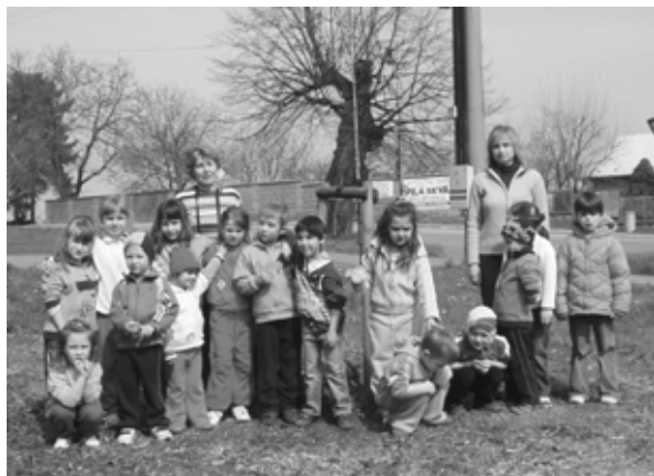
Děti se u mladého stromu, který společně pomáhaly zasadit, nechaly na památku vyfotografovat.

pár let stromy vytvoří příjemné klima nad možná až příliš rozsáhle vydlážděnou plochou.