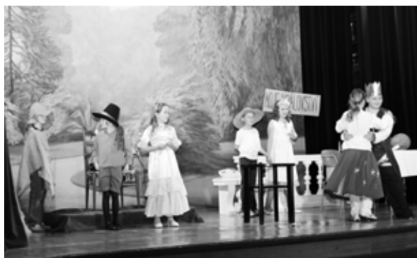
Klasickou pohádku Sůl nad zlato představil kroměřížskému publiku Divadelní kroužek BVS Komenský z Vídně.

Na letošní přehlídce od 10. do 14. května zhlédli diváci tyto pohádky: Jak princezna Máňa vysvobodila Honzu z pekla – Církevní ZŠ, Kroměříž; Sůl nad zlato – BVS Komenský Vídeň; Muzikál ze základní – ZŠ Zborovice; O žabce královně – ZŠ Zámoraví, Kroměříž; Opice Žofka – ZŠ Zachar, Kroměříž; Sněhová královna- loutkové divadlo při MŠ a ZŠ Litence; Loupežnické kořeny – ZŠ Komenského nám., Kroměříž; Kouzlo vody – ZŠ a MŠ speciální, Kroměříž a Z pohádky do pohádky – ZŠ Kostelec u Holešova.