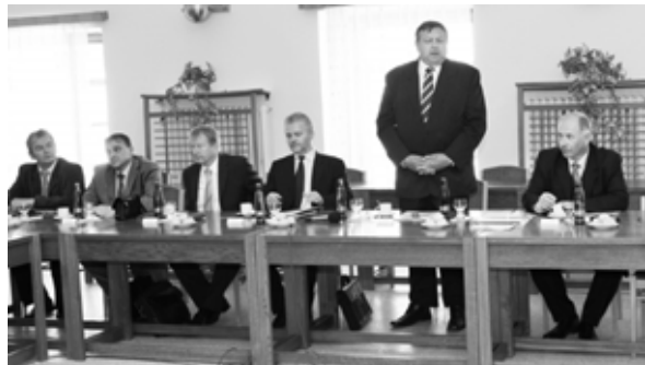
Delegaci Zlínského kraje představil hejtmán Stanislav Mišák.

Při pracovním jednání byla starosty několikrát zmíněna také Strategická průmyslová zóna Holešov a její budoucí potenciál pro zdejší region. „Projekt Strategické průmyslové zóny Holešov realizujeme ve spolupráci s Ministerstvem průmyslu a obchodu ČR a agenturou CzechInvest ve střednědobém horizontu pěti až deseti let, během kterých očekáváme postupné obsazování zóny desítkami tuzemských a zahraničních investorů, kteří mohou ve svých provozech zaměstnávat tisíce lidí. Současným efektem Strategické průmyslové zóny Hole-