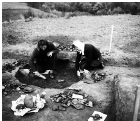
Na archeologickém výzkumu v Hradisku se pracovně podílela řada místních občanů. Archivní snímek z r. 1949.