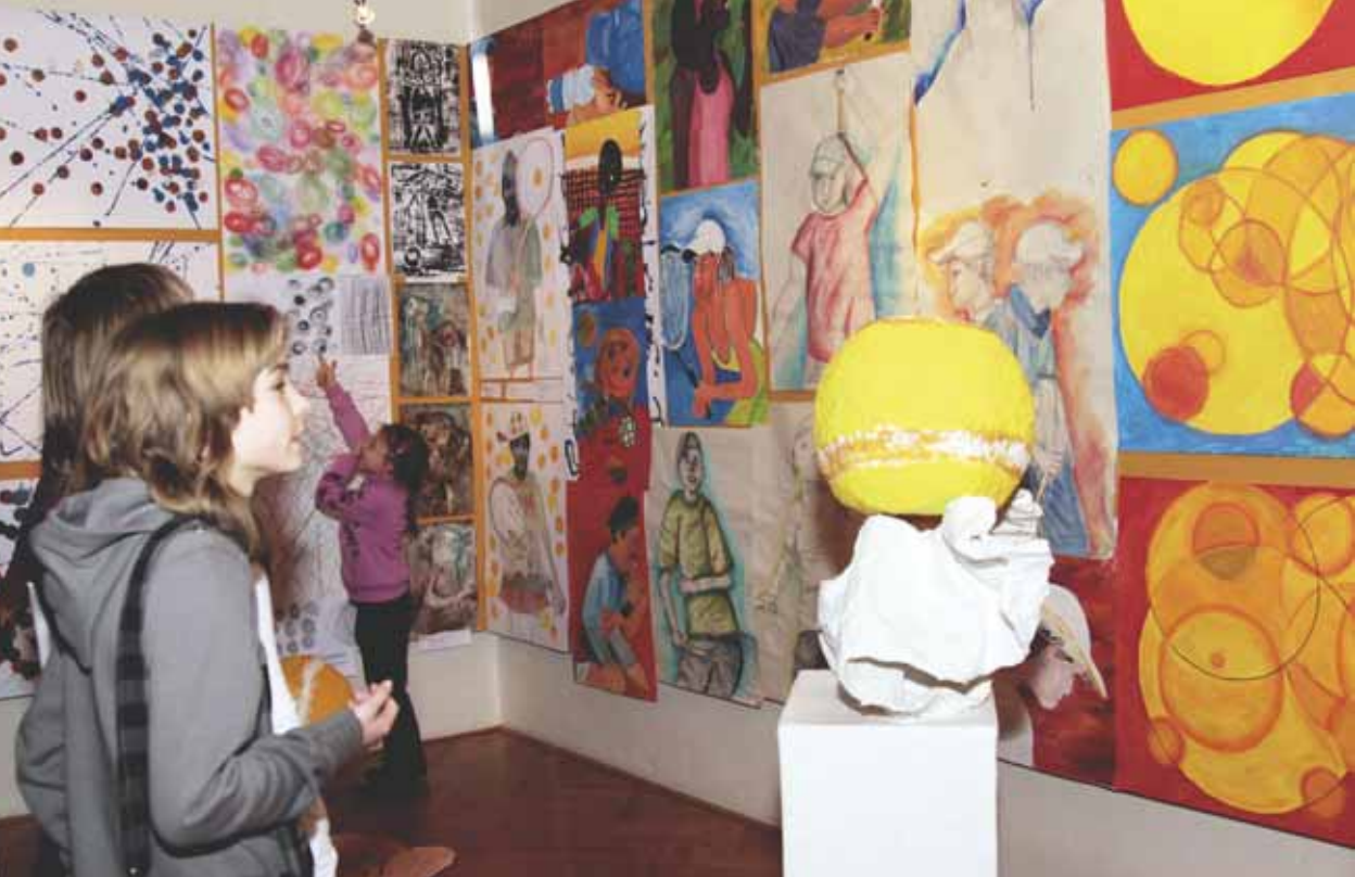
V rámci výstavy Průřezy se v Galerii Orlovna a v galerii Muzea Kroměřížska prezentovali mladí výtvarníci ZUŠ Kroměříž a ZUŠ Brno Veverí.