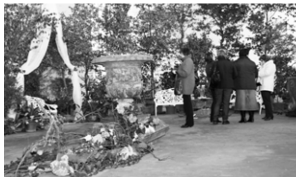
Zahájení výstavy kvetoucích kamélií bylo hojně navštíveno.

Kvetoucí skvosty, nádherné kamélie, zakonponovali zahradníci Květné zahrady mezi fragmenty uměleckých děl z pískovce, mezi nimiž stála i jedna ztvárňující boha