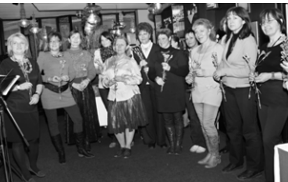
Dámská jízda aneb Malovaný Den Žen v kavárně Slavia