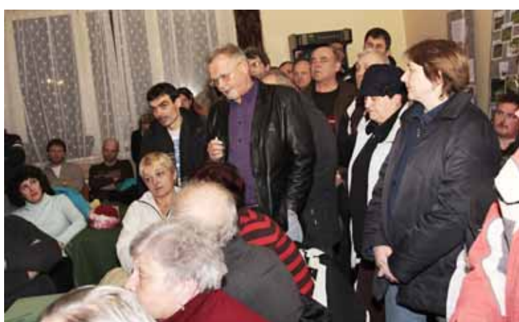
Ve Vážanech byl sál restaurace přeplněn, občany zajímal především osud místního hliniště.