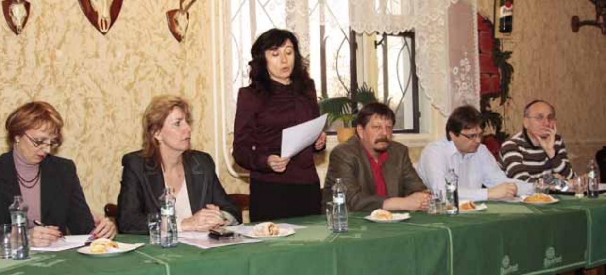
Setkání vedení města s občany místních částí měla příznivý ohlas a stala se užitečným zdrojem informací pro obě strany.