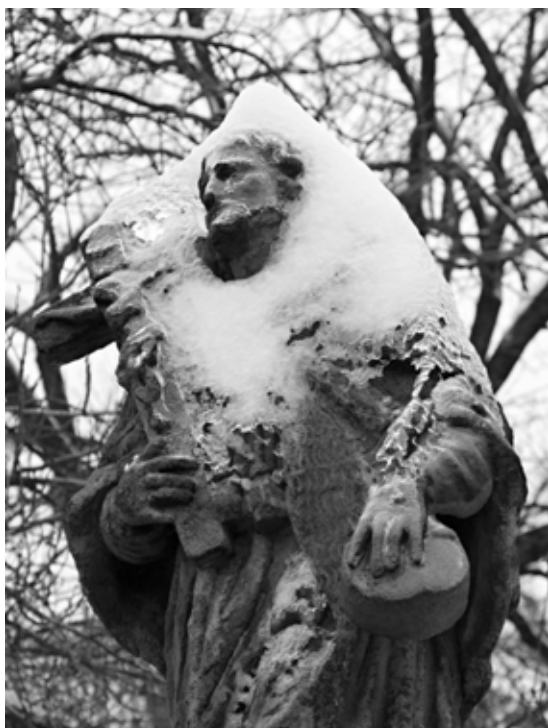
Sv. Jan Nepomucký v Bezručově parku dostal nové roucho z Ledového království.