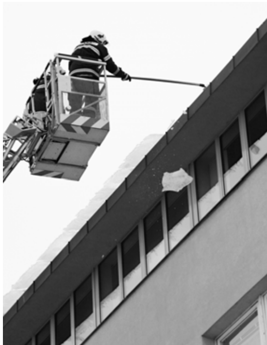
Hasiči odstraňují nebezpečné ledové převisy ze střechy budovy „B“ Městského úřadu na Husově náměstí