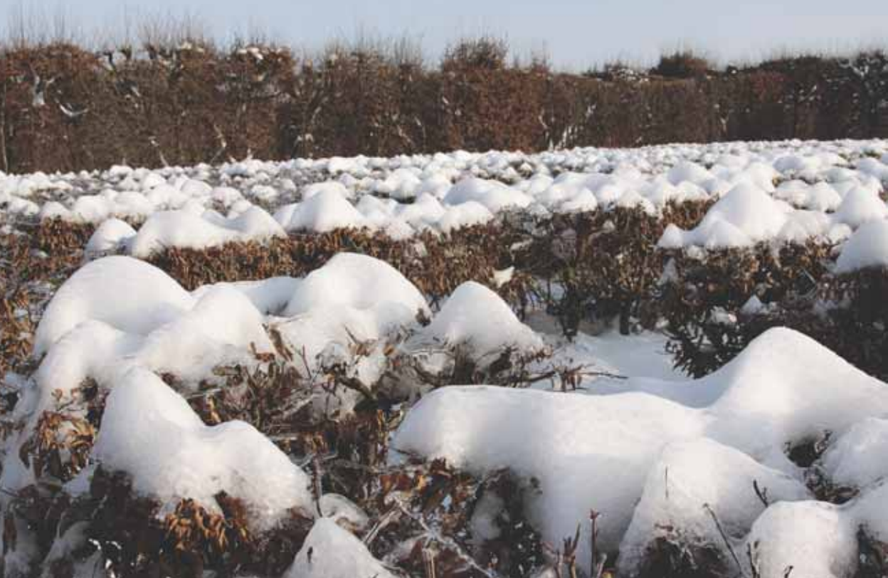
Zasněžené bludiště v Květné zahradě.