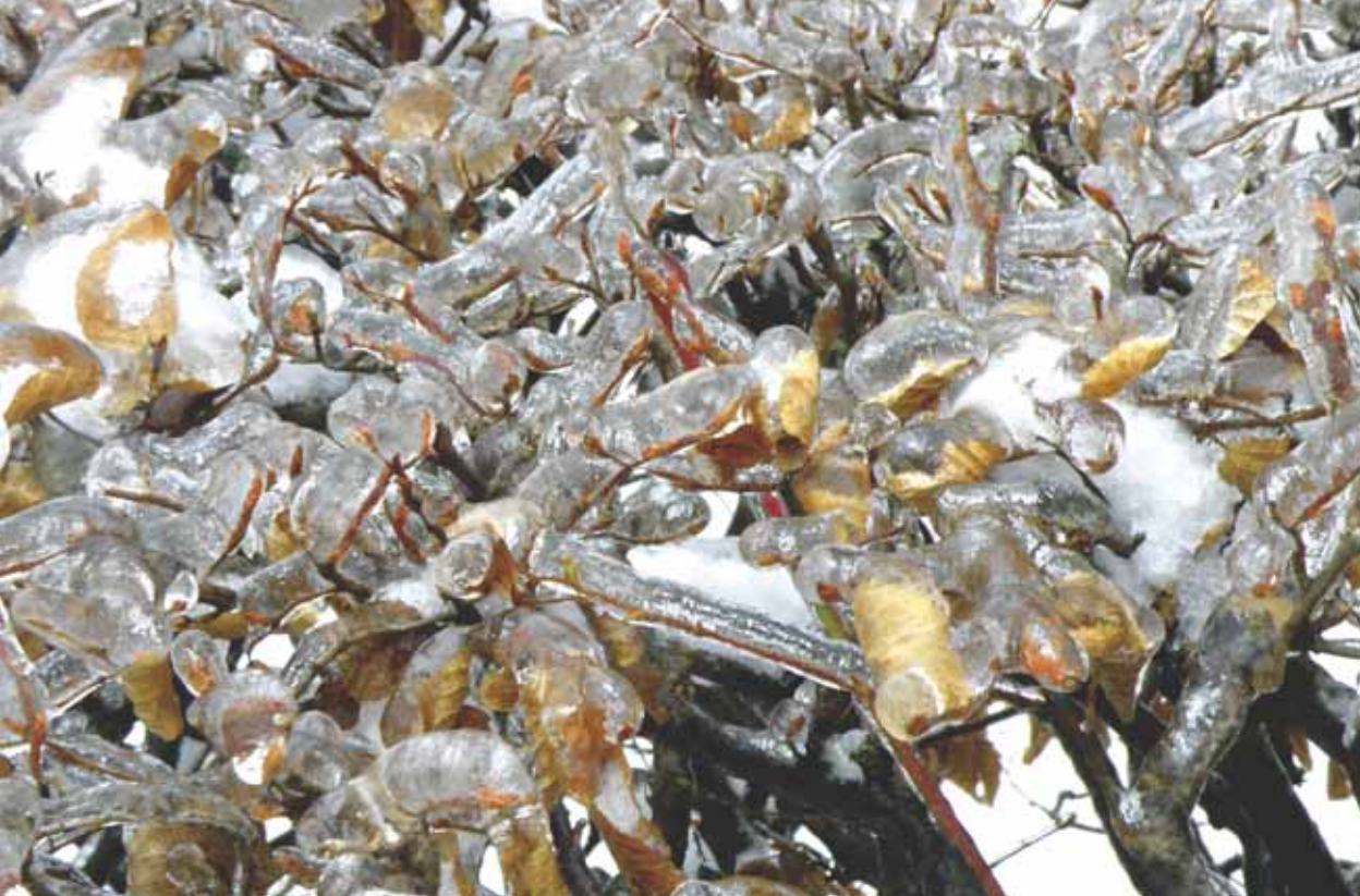
Ledovou krásu v Květné zahradě zachytil ing. Jiří Čermák. Foto zadní straně obálky Miroslav Karásek.