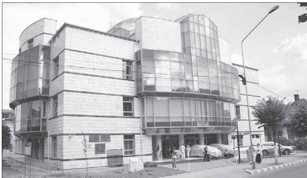
Budova knihovny v Ramnicu Valcea.