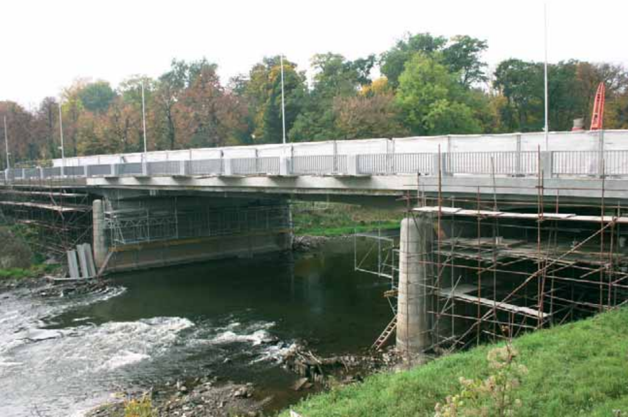
Opravy mostu přes Moravu a kolejiště pokračují i v listopadu.