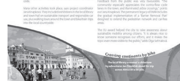
Stránka z evropského almanachu věnovaná Kroměříži.