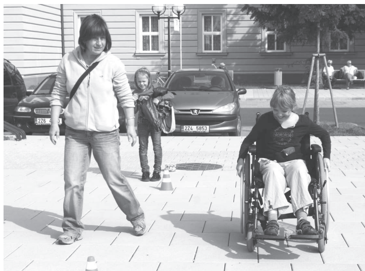
Hlavní část letošního programu ETM se letos konala na Hanáckém náměstí. Nechyběla však ani tradiční cyklojízda či beseda se zajímavými osobnostmi o cestování.

Kroměříž - Prestižní almanach k 10. výročí dnes již tradiční kampaně s názvem Evropský týden mobility (ETM) vydala v letošním roce Evropská komise. Publikace komentuje význam i dopady kampaně v uplynulé dekádě a představuje města, která byla v pořadí ETM neaktivnější. To samo o sobě by asi nebylo nijak výjimečné, kdyby se mezi dvaadvaceti evropskými metropolemi nenacházela i Kroměříž. Společnost, v níž se naše město pohybuje, je vskutku elitní. Najdeme v ní například italskou Boloňu, Budapešť, Ženevu, Kodaň, Krakov, Rigu, ale i Záhřeb, rumunský Arad, švédský Lund či Las Palmas na Kanárských ostrovech. Čím si město Kroměříž tuto pozornost zasloužilo? „Město Kroměříž v roce 2004 zaujalo oproti ostatním účastníkům Evropského týdne mobility svým originálním programem, který byl založen zejména na zapojení žáků. Ti si navzájem mezi sebou vyměňovali rady a zkušenosti o bezpečnosti provozu na ulicích a silnicích,“ je uvedeno v evropském almanachu. „Všichni noví prvňáčci tehdy dostali od svých starších spolužáků reflexní náramky a starší žáci mladším dětem zároveň předávali cenné informace, jak se bezpečně pohybovat na silnicích a ulicích a jak se ve zdraví dostat do školy a