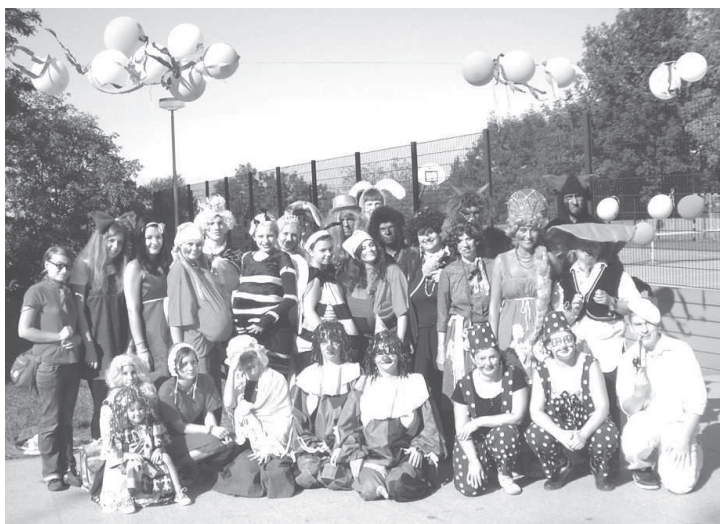
Snímek z Pohádkového Žlíbku, který se letos konal v těšnovickém areálu.

Těšnovice - Žlíbek, areál ležící na pozemku města Kroměříže a TJ Těšnovice, zažíval až do roku 1986, kdy obec fungovala jako samostatný subjekt, svou dobu slávy, poté úpadku, aby pak v roce 2001 byl znovuobjeven a vysekán z džungle. Těšnovičtí obyvatelé ve vlastní režii opravili zničený hudební altán a taneční parket, umístili sem obytné buňky sloužící jako bufet, postavili dvě pergoly a v neposlední řadě dva provizorní dřevěné záchodky. K obnově kdysi slavného výletišťe přispělo město Kroměříž částkou 30 tisíc korun, která posloužila zejména na pokrytí nákladů na osvětlení areálu. Vrcholem novodobé historie Žlíbku se stala stavba víceúčelového hřiště v hodnotě 4,2 milionu korun hrazená z dotačního programu MŠMT. Žlíbek je mimo jiné místem konání každoroční hodové zábavy, dětského dne na rozloučení s prázdninami, výletním cílem mateřských škol apod. Jeho širší využití je však velmi omezené. Už asi před 2 lety se hovořilo o možnosti, že by se tu konalo mistrovství seniorů, byly plány uskutečnit zde i folklorní festival. Není to však možné. Důvod? Chybějící hygienické zázemí. Dva desetileté dřevěné záchodky a plechové koryto na mytí rukou zcela jistě nevyhovují žádným z hygi-