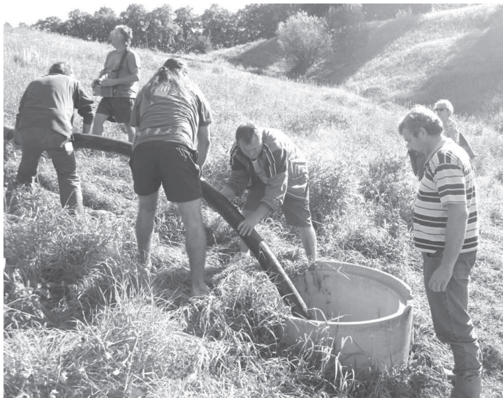
Pomocí mechanického ramena bylo nutné dostat hadici s betonovou směsí od domíchávače až k jínce u paty skládky.