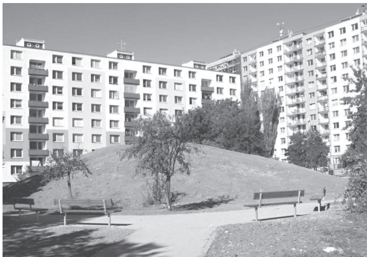
Novinkou na sídlišti Oskol jsou mimo jiné i fitness prvky či kopec na sáňkování pro děti.

Práce na sídlišti už od samého počátku komplikovalo špatné počasí doplněné poněkud živelným nástupem realizační firmy, která navzdory požadavku města provádět opravy postupně rozkopala chodníky najednou. Kvůli stanoveným termínům se pak muselo často dělat i v dešti, což komplikovalo pohyb chodců. A průběžně bylo třeba řešit také některé nedostatky v projektu i odvedené práci. „Operativně jsme reagovali na připomínky lidí. Upozorňovali například na bezbariérový přístup k vjezdům a vchodům, provedení chodníků a hodně reakcí samozřejmě přišlo na kácení stromů. Škoda, že mnohé podněty přišly až po ukončení pra-