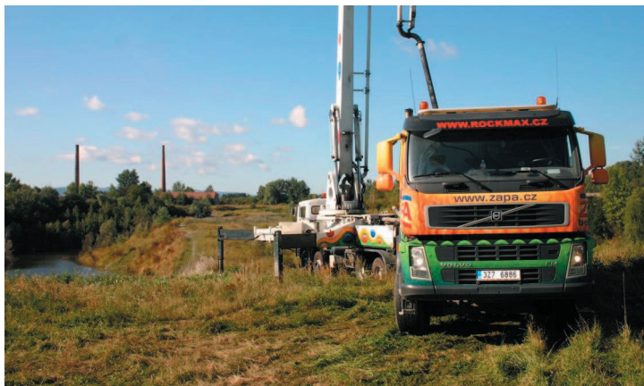
Domíchávač a speciální mnohametrové mechanické rameno musely přijet až na samotný okraj bývalé zacharské skládky.

ništi vážanské cihelny, toto riziko přece jen existovalo a tímto preventivním opatřením jej eliminujeme. ... pokračování na str. 2