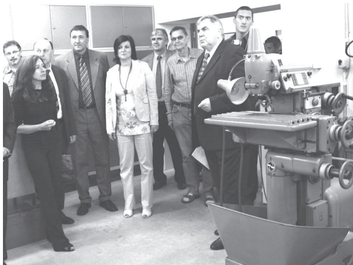
Hosté si prohlédli vybavení dílen strojírenských učebních oborů.