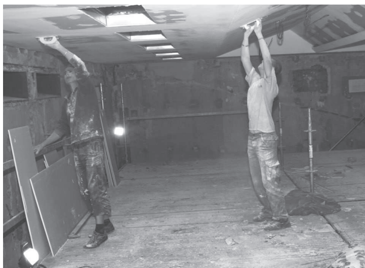
Rekonstrukce kina Nadsklepi.

si staveniště kina a zároveň se informovat na vše, co s rekonstrukcí za 38 milionů korun souvisí, včetně problematiky výměny oken, osudu 3D technologie či instalace nového pódia na Velkém náměstí. Zajímavý může být už jen pohled do vybouraného promítacího sálu, kde se právě montují sádkartonové podhledy a začíná se dělat akustické obložení. Den otevřených dveří mohou zájemci navštívit v době od 8 do 12 hodin (pz)