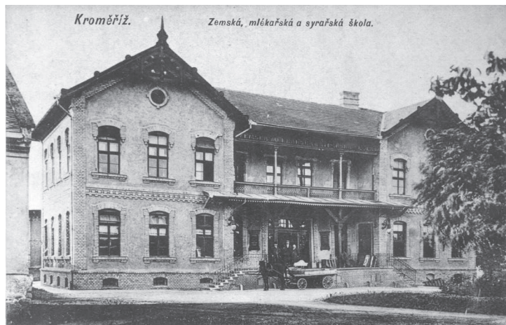
Dobový pohled na historickou budovu mlékárenské školy v Kroměříži.

Naše škola je profilovaná do oblasti potravinářství. I když má v názvu mlékárenská, zdaleka nemusí absolvent pracovat jen v mlékárenském průmyslu. Díky biochemii, kdy jednou vznikne z mléka tvarůžek, podruhé ementál a potřetí jogurt, je příprava našich studentů pro praxi tak široká, že uplatnění najdou v příbuzných potravinářských oborech. Naši absolventi pracují v masném i kvasném průmyslu, v oblasti státní potravinářské a hygienické kontroly. Kromě všeobecných