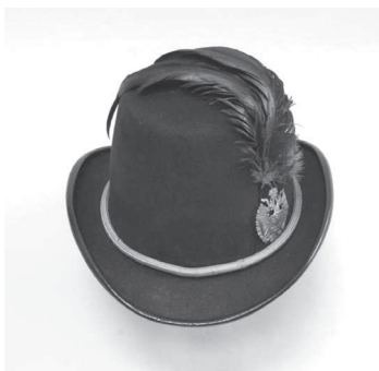
Klobouk strážníka do roku 1918.