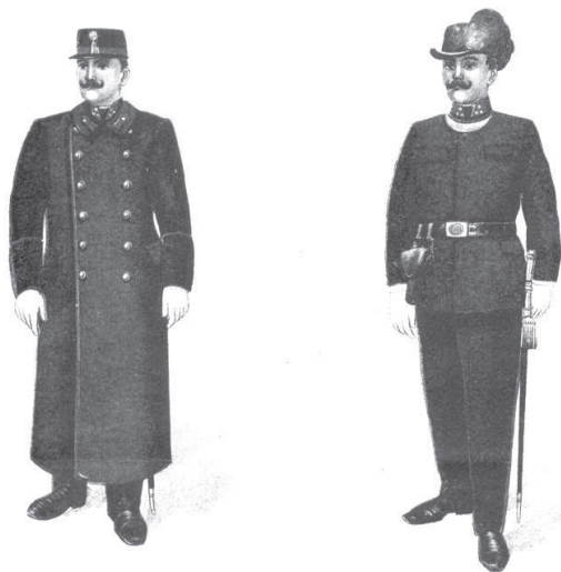
Uniforma strážníků v roce 1908.

Policejní komisař měl dozor nad celkovou službou policie. Vrchní strážník mu podával veškeré stížnosti na strážníky, návrhy o potřebách a žádostech. Policejní komisař tlumočil návrhy městské policie starostovi města, případně městské radě a zodpovídal starostovi za řádný chod služby. Strážníci byli rozděleni na dvě oddělení, kdy každé z nich sloužilo 24 hodin od 7 do 7 hodin ráno. Již v roce 1908 měli policejní strážníci uniformu v podobě, kterou vidíme na obrázku.