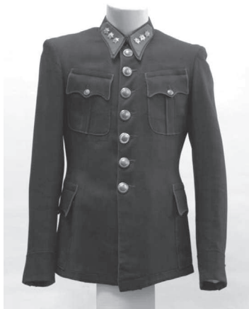
Uniforma strážníků po roce 1918.

jednotlivě vykonávali svou službu. Ve dne sloužili po jednom, v noci většinou ve dvou a v případě potřeby si píšťalkou přivolali posilu. Strážníci byli neustále k vidění, měli dozor na trhu, při demonstracích a slavnostech, při vojenských přehlídkách nebo sportovních utkáních. V noci několikrát kontrolovali nádraží a předepsanou zavírací dobu v kavárnách a restauracích, nebo zda jsou řádně uzamčené obchody. Další činnost policejních strážníků nám přibližuje statistický výkaz z roku 1933, kdy pro různé trestné činy bylo oznámeno 1114 osob, z toho zatčeno 57. Mezi těmito činy můžeme najít například veřejné násilí, rušení nábo-