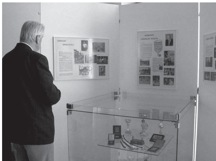
Historii kroměřížského Sokola letos přiblížila i výstava v Muzeu Kroměřížska.