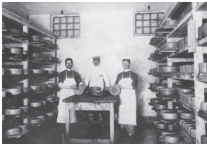
Praxe byla vždy nedílnou součástí výuky na škole...