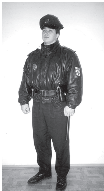
Uniforma strážníků v roce 1992.

V polovině roku 1992 bylo zahájeno výběrové řízení na místo strážníka, vybráno bylo celkem 14 uchazečů a po absolvování zkoušek a potřebných školení mohli strážníci 27. září vyjít do ulic. Městské zastupitelstvo Kroměříž totiž schválilo dne 3. 9. 1992 obecně závaznou vyhlášku o Městské policii Kroměříž, která nabyla účinnosti 22. 9. 1992. V té době byl starostou města, a tím také nejvyšším nadřízeným měst-