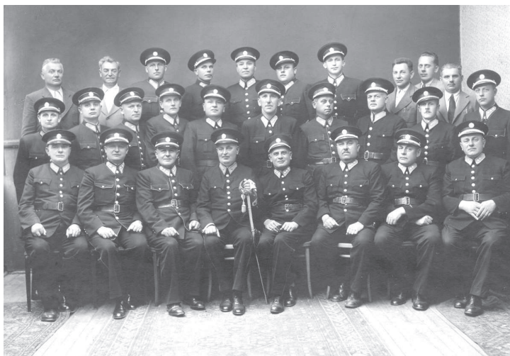
Městská policie v roce 1941.

Město bylo rozděleno na několik rajonů, kde strážníci