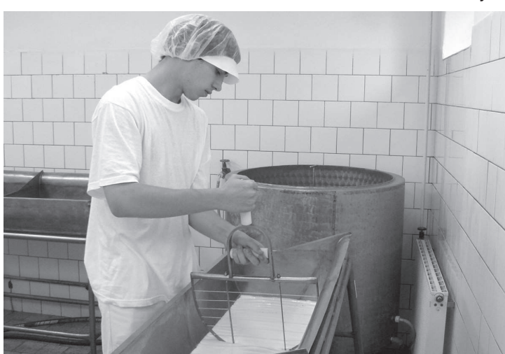
... a nejinak je to mu i dnes.