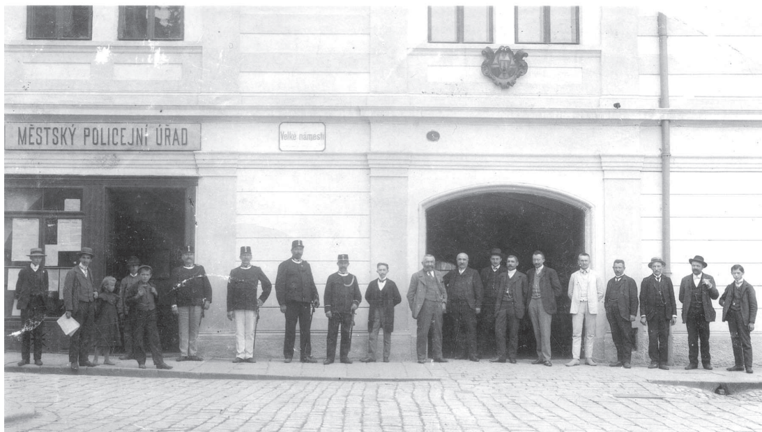
Služebna městské policie na Velkém náměstí před I. světovou válkou.

V roce 1872 obecní rada města Kroměříže vypsal výběrové řízení na městského policejního strážníka. Tímto letopočtem si letos připomínáme výročí 140 let od založení původní městské policie.