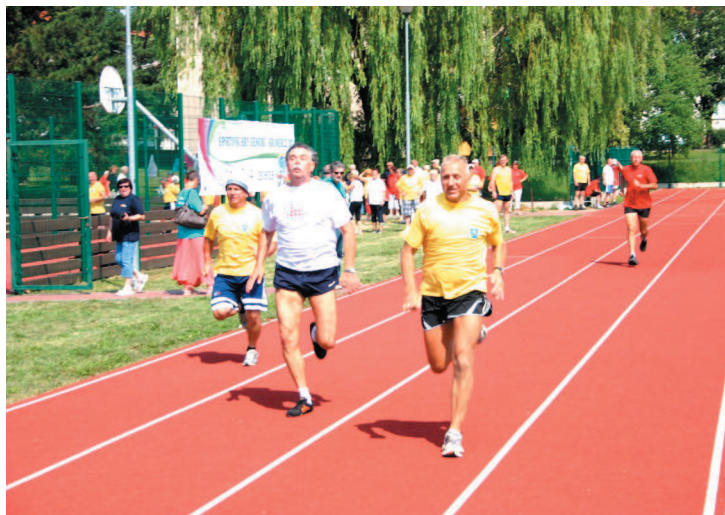
Běhy na 60 a 400 metrů, ale i štafety na 4 x 60 metrů byly v tropickém horku obzvláště náročnými disciplínami.