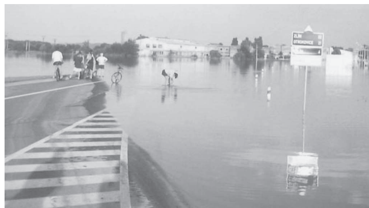
Obchvat města zmizel i s Kaplanovou ulicí pod hladinou.

ných letech, zejména v chvílích, kdy povodně opět pohrozily a voda odhalila nová slabá místa. Jednalo se například o lokality Dolních a Horních Zahrad, ulici Za Oskolí, břehy potoka Zacharka v lokalitách Na Hrázi a Čápka, hráz u stavby dálničního mostu v Horních Zahradách, pravý břeh podél Podzámecké zahrady až po železniční most ve směru na Kojetín, Wolfův splávek atd.