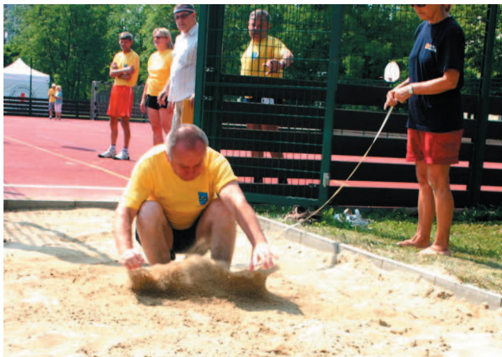
Obdivuhodné výkony naši i zahraniční seniori podávali i ve skoku do dálky.