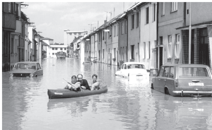
Pohled do Bartošovy ulice.

fázi hned po povodních došlo k opravám kanalizace, instalaci zpětných klapek, šnekových čerpadel, k čištění břehů od náletových dřevin i k celkové úpravě břehů kvůli zvýšení jejich kapacity. Začaly se budovat suché poldry, inundační prostory pro řízený rozliv velké vody zejména do lužních lesů a polí. V Kroměříži a blízkém okolí došlo i ke zpevňování a navyšování hrází