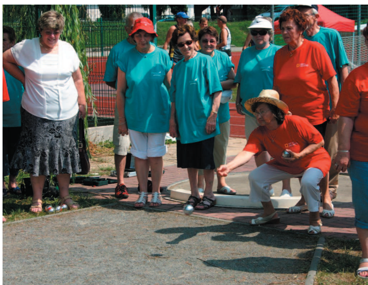
Přestože má pétanque v Kroměříži slušné zázemí, soupeřit s francouzskými týmy byla pro mnohé zdejší hráče výzva.