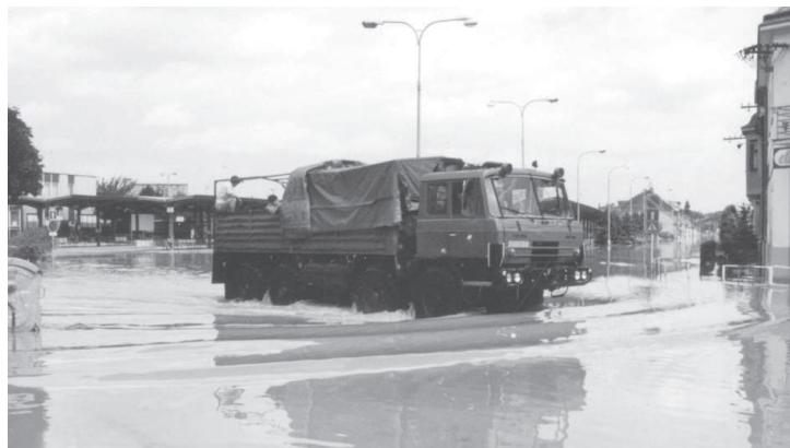
Záchranáři na vojenské tatře před autobusovým nádražím.