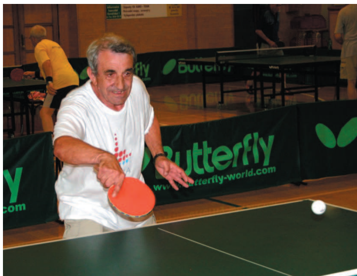
Profesionální zázemí pro stolní tenis sportovním hrám seniorů poskytla hala TJ Slavia Kroměříž.