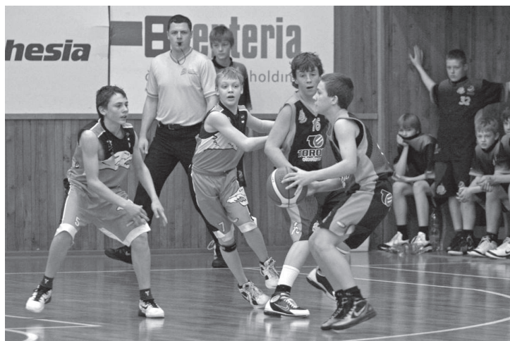
Vlčata TJ Slavia Kroměříž během finálového zápasu v Pardubicích.

basketbalový tým se přihlásil do 1. ročníku AND 1 CUPU a musel projít okresními a krajskými koly a poté úspěšně absolvovat kvalifikaci na republikové finále. Ve všech těchto kolech neměli školáci ze Slovanu konkurenci a probjovali se až k účasti na vrcholném turnaji těch nejlepších ze základních škol a víceletých gymnázií, který proběhl ve dnech 16. až 18. května v Klatovech. K vidění byly velmi vyrovnané zápasy, za které by se nemusely stydět ani ligové týmy. Turnaj měl dvě roviny. Jednou byla část základní, kde proběhly vyrovnané boje o semifinále, a druhou byla semifinálová utkání a samotné finále. Skupinu A vyhrál tým z Kroměříže a skupinu B tým z Pardubic. První finalistka pak vzešel ze zápasu Kroměříž – Sparta. „V semifinále jsme jen těsným rozdílem neporazili velmi těžkého soupeře z Prahy, ale v boji o třetí a čtvrté místo patřila hra nám. Takového úspěchu ZŠ Slovan v basketbalové soutěži