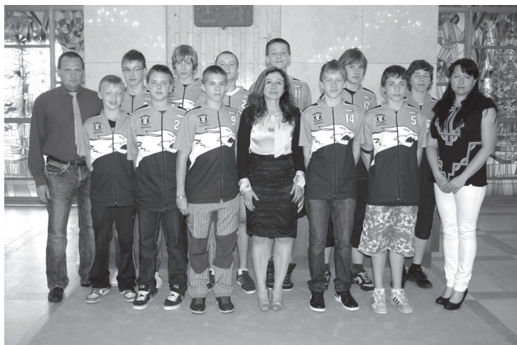
Stříbrné basketbalové družstvo TJ Slavia Kroměříž při přijetí na kroměřížské radnici.