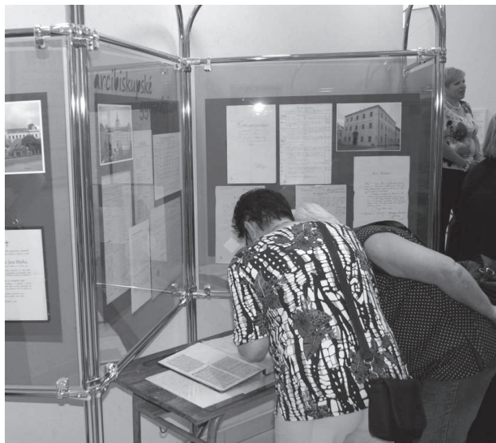
Výstava Kroměřížská gymnázia nabídla zajímavé archiválie i muzejní předměty pětice předních kroměřížských škol.

klad listina z roku 1660, kterou Jan hrabě z Rottalu dává holešovským měšťanům právo vinného šenku, listina olomouckého biskupa Karla z Lichtenštejnu z roku 1689 zřizující fundaci pro chudé při kroměřížském špitále a k nahlédnutí byl i nejstarší dokument kroměřížského archivu - listina z roku 1483, kterou „Václav z Ludanic a na Veveří přenechává svým poddaným v Ratajích právo odúmrtí a zároveň jim předává les nad vesnicí za pravidelný plat (dvakrát ročně) a naturální dávky.“ Další zajímavou expozicí inspirovanou 130. výročí založení českého gymnázia, která