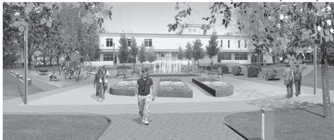
Návrh možné podoby Slovanského náměstí.