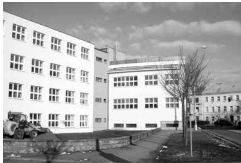
To samé místo dnes.

úřadu v poslední době zaznamenal tento kousek veřejné plochy, v dávné minulosti příslušející ke kroměřížskému předměstí Za Kovářskou bránou. Původně se tu nacházely zahrady a humna dvou předměstských dvorců a posléze „nový“ městský hřbitov, který byl založen krátce po polovině