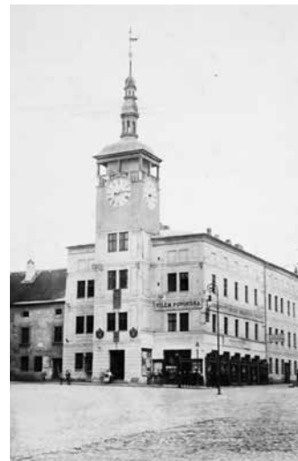
Radnice na počátku 20. století.