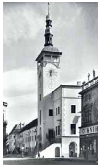
Radnice v letech 1957-1958.