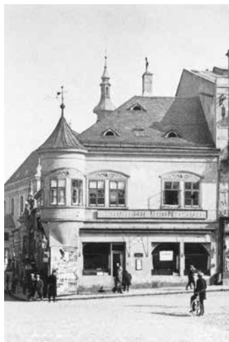
Šenkovní dům s renesančním arkýřem na Velkém náměstí č.p. 107 – dnešní prodejna firmy Baťa. Do roku 1930, než byl dům demolován, zde fungovala známá Vrbíkova kavárna.

Po vyčerpávajících válečných dobách husitství a bojů mezi českým panovníkem Jiřím z Poděbrad a uherským králem Matyášem Korvínem v druhé polovině 15. století, kdy se v Kroměříži vystřídal řada zástavních držitelů, začal novou významnou kapitolu uměleckého a stavebního rozvoje města psát biskup Stanislav Thurzo (1497-1540), původem uherský šlechtic, krakovský kanovník a humanista. Rodinné vztahy, úzké kontakty s představiteli evropského humanismu a znalost italského prostředí umožnily biskupovi vybudovat v Kroměříži středisko renesanční kultury. Kromě toho se mu podařilo obnovit lenní systém biskupství a činnost manských soudů a sněmů (zavedl na jednání češtinu jako úřední jazyk). Biskup zahájil radikální přestavbu svého sídla (hradu?), kde vnikla mohutná vstupní věž, vybavená malířskou a sochařskou výzdobou. Jeho významným počinem bylo i zakoupení kolekce obrazů Lucase Cranacha st, které jsou dodnes chloubou zámecké obrazárny. Částečných úprav se dočkal zrušený kostel sv. Mořice. Město obemklo nové opevnění a posílení se dočkaly i městské brány. Intenzivní stavební činnost, dodnes patrnou