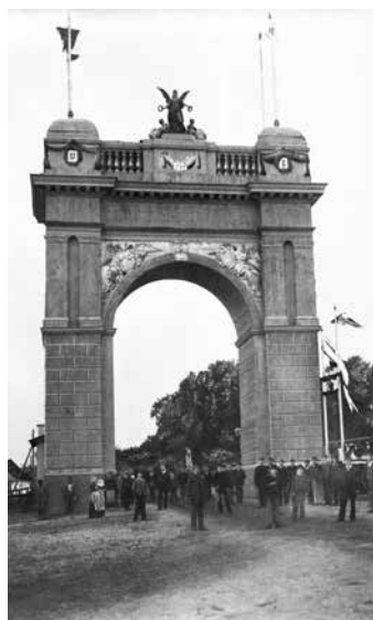
Slavnostní brána k uvítání ruského cara Alexandra III. a rakouského císaře Františka Josefa z roku 1885.