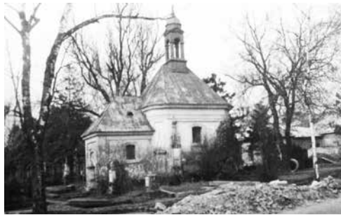
Archivní snímek hřbitovní kaple z doby rušení hřbitova na Kotojedské ulici.

Není tak dávno, co zmizely vzrostlé smrky v zelené ploše mezi budovou Okresního, dnes Finančního úřadu a chodníkem na Kotojedské ulici. Nevelký prostor bude totiž sloužit jako parkoviště. Další z proměn, kterou spolu s revitalizací Bezručova parku a rekonstrukcí Finančního