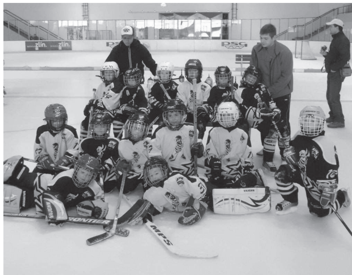
HK Kroměříž - přípravka, 3. a 4. třída.

Starší žáci byli novou kategorií, kterou v letošním roce Hanáci představili. Kluci sice měli slabší začátek sezony, nicméně po novém roce se výkonnost hráčů velmi strmě posunula nahoru. Základní část Hanáci zakončili na postupovém čtvrtém místě se 17 body a aktivním skóre 67:43. V nadstavbě Hanáci nepatřili k favoritům soutěže, ale z osmi celků se klukům podařilo skončit na pěkném čtvrtém místě, což bylo letošní maximum, které Hanáci mohli uhrát. Před Hanáky skončilo pouze Znojmo, Zlín a brněnská Kometa. Za sebou kroměřížští hokejisté nechali například nejlepší rakouský mládežnický klub Tigers Vienna či Hodonín. (hk)