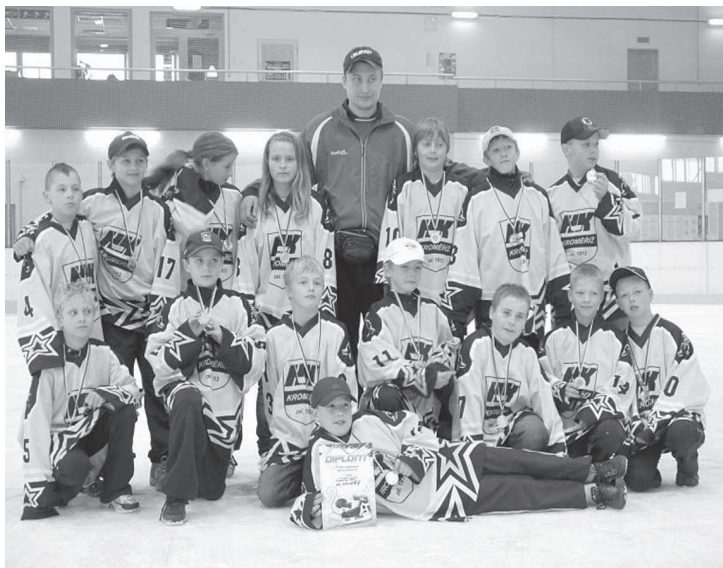
HK Kroměříž - mladší žáci.