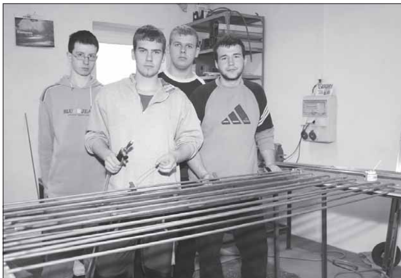
Studenti SOUSe ze Zlatých Moravců se seznamovali s technologií výroby trubicových kolektorů ve firmě VERMOS, s.r.o.