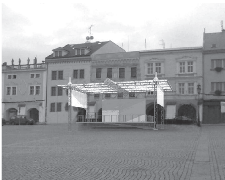
Vizualizace nového pódia, které bude na náměstí stát od letošního dubna.

I když po 14 letech konstrukce z náměstí definitivně zmizela, město si ji nechá k dalšímu využití. Náměstí ale dlouho prázdné nezůstane. Už na jaře na stejném místě vyroste jako součást projektu „Infrastruktura pro kulturní akce v Kroměříži“ pódium nové. „Jeho půdorys v největším rozměru bude 15 x 10 metrů a samotná využitelná plocha 10 x 8 m. Pódium bude stát asi 3 miliony korun a dokončeno by mělo být nejpozději koncem dubna,“ uvedl vedoucí odboru rozvoje Josef Koplík. Pódium bude složeno z pevné části, která bude řešena jako stálá stavba, a z demontovatelného zastřešení, které bude využíváno v období letní sezony. (pz)