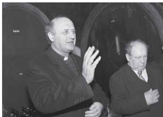
Arcibiskup Jan Graubner požehnal úrodu vína ročníku 2008.