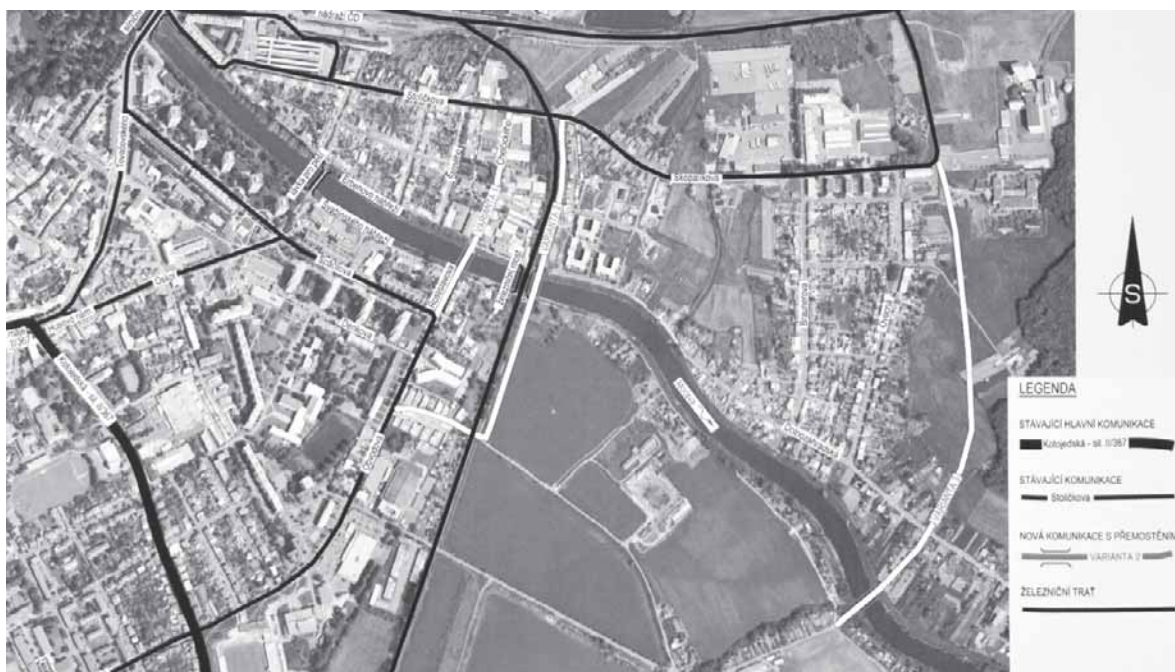
Reprofoto plánu nového silničního mostu v Kroměříži.

„Nové řešení, které by odlehčilo silniční dopravě ve městě, už nelze hledat na severu, musíme jít na jih,“ pokračuje Jan Slanina. „Odborné studie, které hledaly nové trasy obchvatové komunikace, našly tři možná řešení. Nový městský most přes Moravu by mohl vést po trase ulic Obvodová - Rostislavova - Chelčického. Toto řešení by ale vyžadovalo demolici jedné strany ulice Rostislavovy. Na Erbenově nábřeží se nachází rozsáhlý