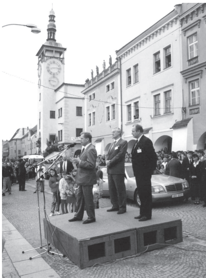
Prezident Václav Havel v roce 1994 při projevu na Velkém náměstí.