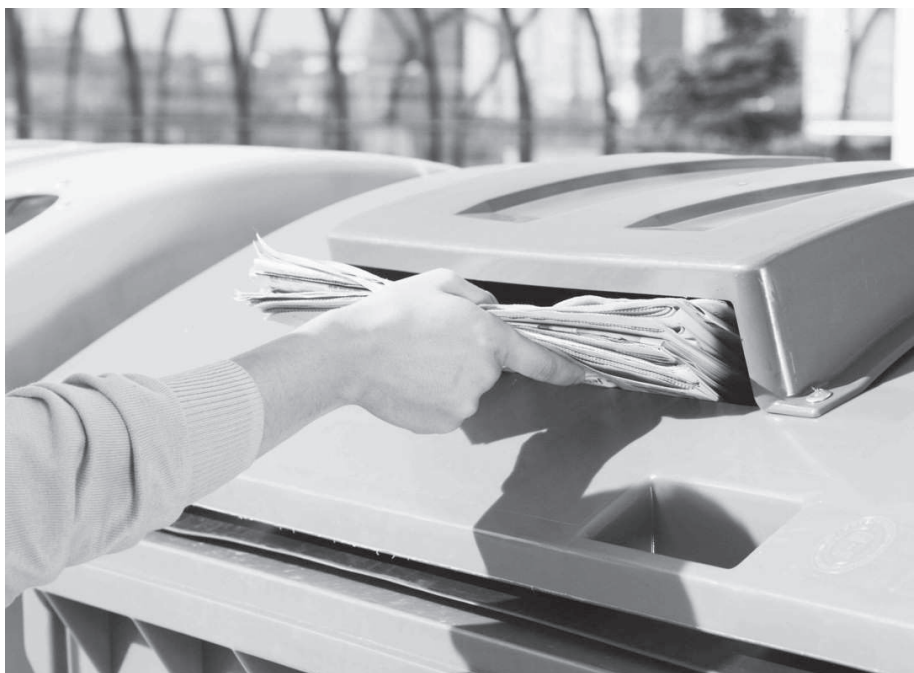
Obyvatelé Kroměříže mohou díky aktivitám na podporu separace třídít papír do nových kontejnerů.

Pětistovka kroměřížských domácností obdržela zdarma speciální sadu žluté, modré a zelené tašky na třídění. Cílem bylo nejen zvýšit množství, kvalitu a čistotu vytríděných odpadů, ale také dát lidem možnost zeptat se na to, co je ohledně třídění odpadů zajímavé. Zda obdarovaným domácnostem tašky a informace v třídění pomohou, a zda tedy akce bude pokračovat i v dalších lokalitách, vyhodnotí za pár měsíců dotazníkový průzkum. Počet těch, kdo třídí, přitom rok od roku roste, už v roce 2010 každý obyvatel Zlínského kraje vytrídil průměrně přes 51 kilogramů papíru, plastu, skla, nápojových kartonů a kovů. A právě i díky tomu může být například 40 procent interiéru auta vyrobeno z recyklovaného plastu, stará PET lahev použita při výrobě nové, nebo vyhozený nápojový karton posloužit jako základ speciální desky, ze které se staví domy. Recyklované věci jsou běžnou součástí toho, co denně používáme, našeho životního stylu. Další zajímavé informace jsou k dispozici na stránkách www.tridenijestyl.cz