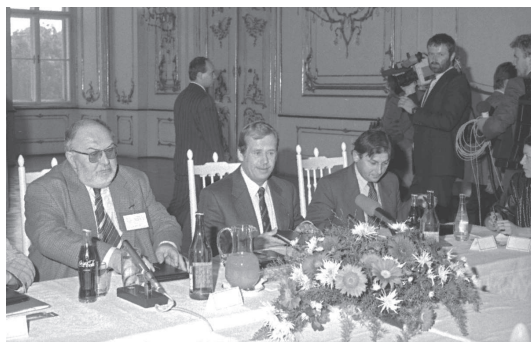
Snímek z kroměřížského setkání prezidenta Václava Havla se třemi premiéry v roce 1990.

5. května 1994 přijal Václav Havel pozvání na konferenci UNESCO „Lidská práva a současná rodina,“ p o ř á d a n o u v rámci Desetiletí duchovní obnovy národa a vyhlášenou kardinálem Tomáškem. V úvodním projevu pan prezident řekl: „Všechny svobody, které přináší demokracie, se vlastně odvíjejí od principu re-