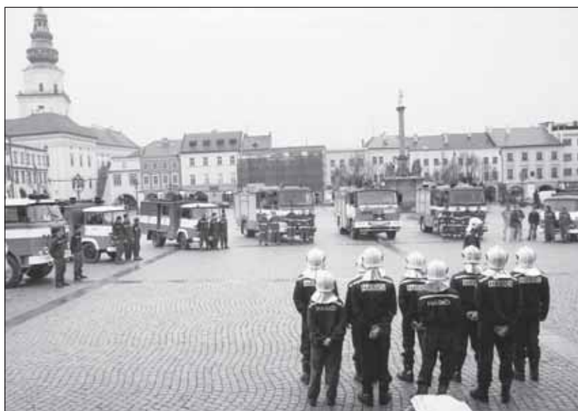
Vedle přehlídky se na Velkém náměstí uskutečnila i menší slavnost se křtem vozu za účasti starosty města, krajského ředitele hasičů a dalších významných hostů.