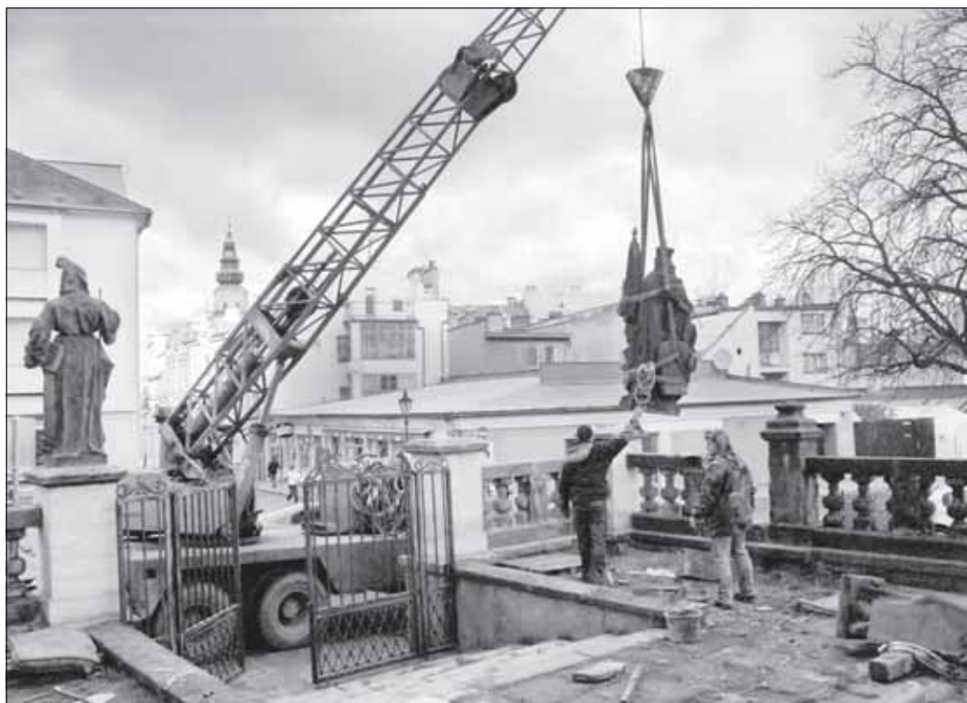
Sochy se vracejí na původní místo.

odborný duchovní asistent děkanátu Kroměříž