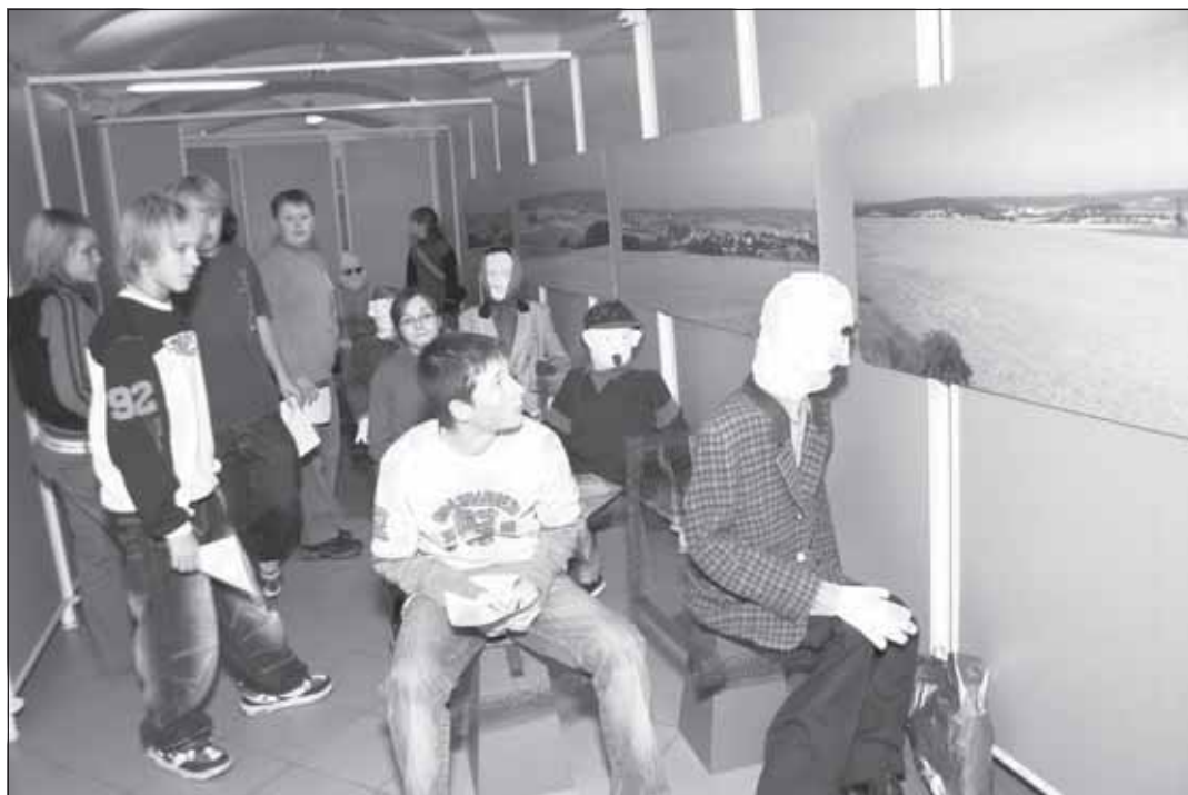
Rasistické nápisy, šikanování a urážlivé výkřiky doprovázejí návštěvníka expozice Labyrint v Muzeu Kroměřížska.