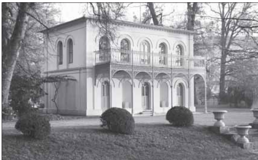
Rybářský pavilon v Podzámecké zahradě.

I v Kroměříži nacházel vzory pro své stavby (například v parčíku olomoucké měšťanské střelnice vystavěl budovu s rotundou). Krásným příkladem sloupového