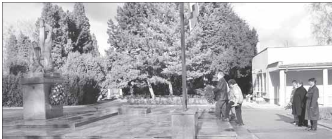
Svátek věnovaný vysloužilcům všech válek včetně novodobých válečných konfliktů si položením věnců a květů u pomníku padlých na městském hřbitově připomněli v pátek 10. listopadu zástupci města a Českého svazu bojovníků za svobodu. Den veteránů se připomíná u příležitosti 88. výročí ukončení první světové války, která skončila 11. 11. 1918 v 11 hodin.