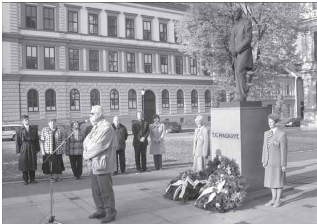
Výročí vzniku Československé republiky uctili zástupci města a Sokolské župy hanácké 6. listopadu položením květů u sochy zakladatele státu T. G. Masaryka na Masarykově náměstí.