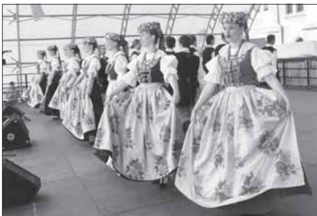
Folklorní soubor z Piekar Slaskich na Dnech polské kultury v Kroměříži.

V květnu se v Nitře konaly Dny české kultury. Kroměříž se prezentovala výstavou obrazů a tapiserií Zdeny