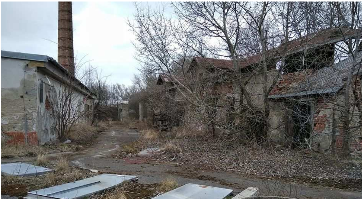
Areál bývalých jatek – detail