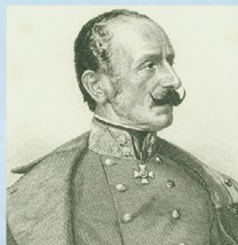
▲ Kroměříž navštívil v červnu 1866 velitel rakouské armády polní maršál Ludwig von Benedek (vlevo), jen o měsíc později do města dorazil pruský generál Adolf von Bonin (vpravo).

Distanz halten! Vždyť dovedli tak přisným býti i k vysokým důstojníkům a záleží-li mu na správné vzdálenosti, ať se pak třesou Prusáci!“ Rakouští vojáci setrvali v Kroměříži až do přesunu Severní armády do Čech, kde došlo u Hradce Králové k rozhodujícímu střetnutí celé války. Po osudném 3. červenci se rakouská armáda dala na ústup. Dne 15. července se Kroměříž stala svědkem přesunu IV. armádního sboru pod velením generálmajora arcivévody Josefa a spojeneckého saského vojska. Nedlouho poté k městu