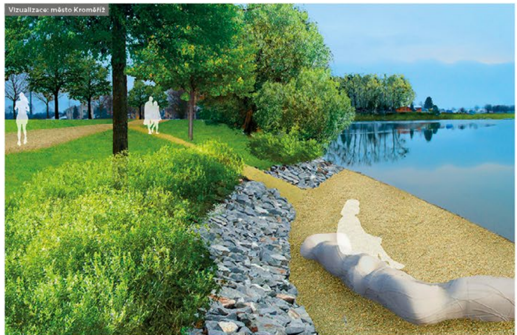
Vizuální studie: město Kroměříž