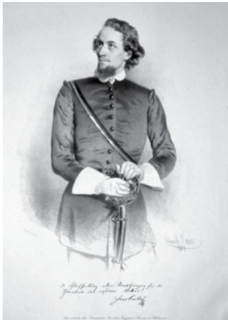
Hans Kudlich.

Historickým datem tohoto roku bylo jistě 7. září, kdy byl vydán patent císaře Ferdinanda o zrušení poddanství. Obsahoval jedenáct bodů týkajících se nejen zrušení poddanství, ale i ustanovení, že se za vykonanou práci má platit, řešeno je zrušení gruntovních břemen atd. a poslední jedenáctý bod pak uvádí: „ Také vázanost k odbírání piva a kořalky se zaujatými v ní povinnostmi přestane “. I toto bylo převratné nařízení, neboť povinné odebírání piva a kořalky poddanými přinášelo vrchnosti nemalé stabilní finanční příjmy. Iniciátor jednání o zrušení poddanství Hans Kudlich pocházel ze