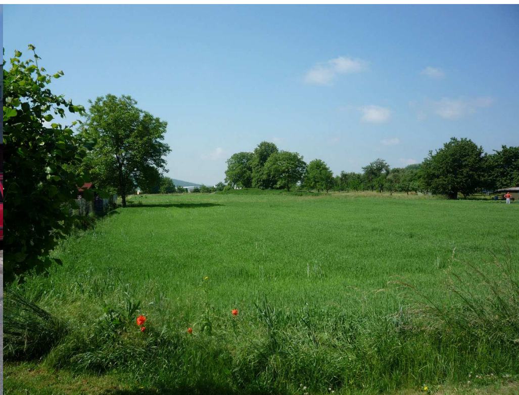
Dolnozahradská - jih, směrem k řece Moravě