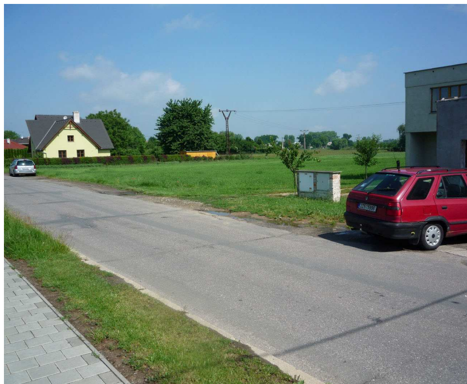
Vyústění obchvatu do Dolnozahradské ze severu