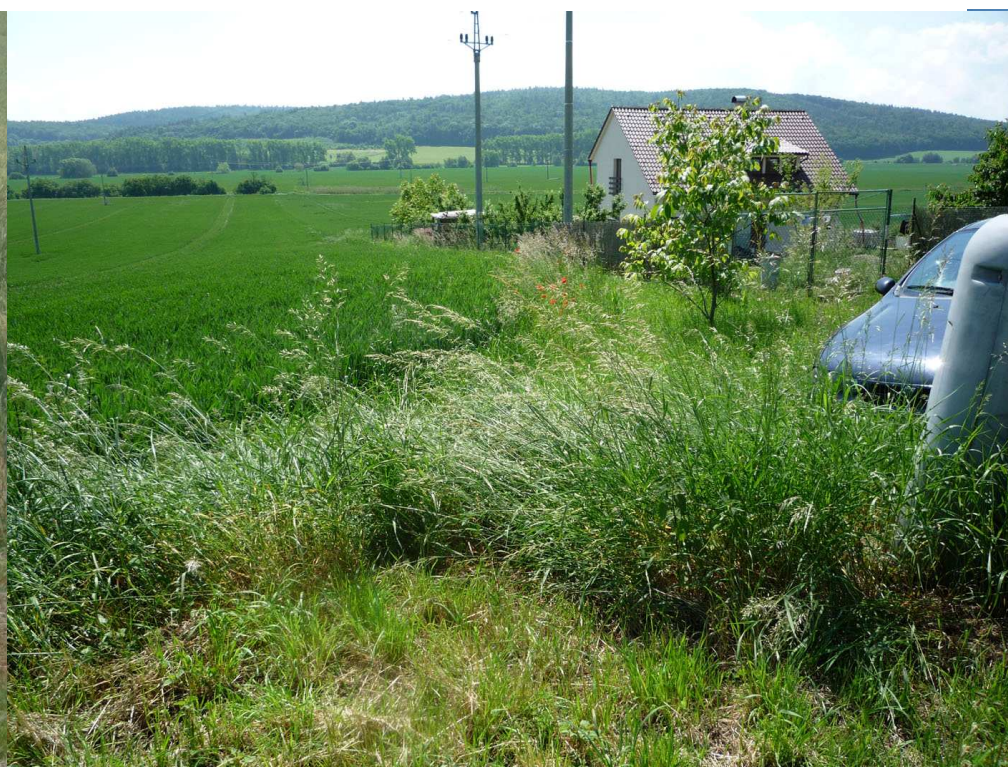
Pohled z Osvoboditelů JV v trase obchvatu