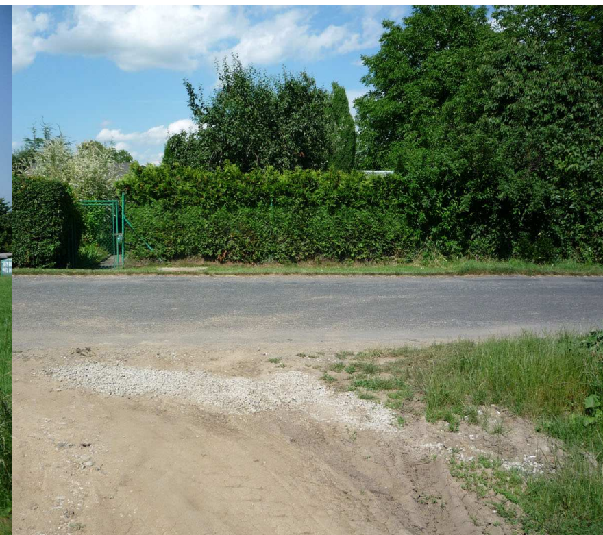
U letiště Na Hrázi - sever, směrem k řece Moravě