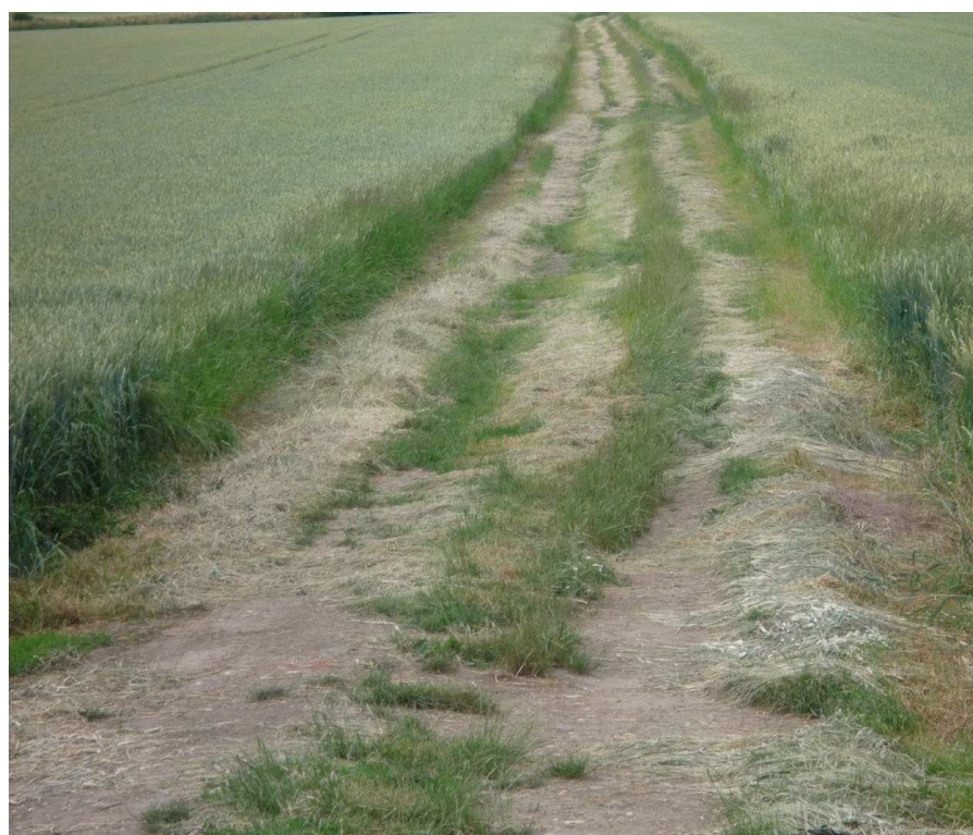
Od silnice II/367 (z Kvasic) směrem k letišti,