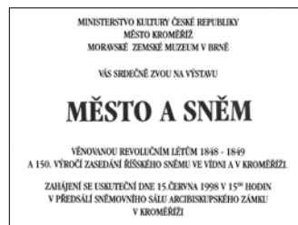
Pozvánka na vernisáž výstavy, pořádané v roce 1998.