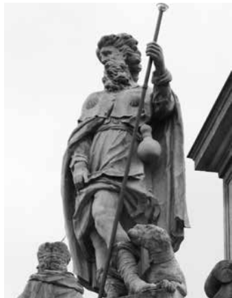
Protimorový patron (a ochránce pejsků) sv. Roch na sousoší Mariánského sloupu na Velkém náměstí