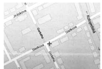
Místo kde stávala kaple sv. Rocha označeno křížkem

Kaple a kostelíky zasvěcené sv. Rochu, světcí a patronu nemocných, lékařů a ochránci proti moru, byly často stavěny na půdorysu kruhu či oválu (kruh jako symbol počátku a konce bytí). Mnohé z nich plnily funkci hřbitovních kostelíků, zpravidla v místech hromadných hrobů obětem moru. Z tohoto důvodu nebo jako poděkování za odvrácení morových epidemií, podobně jako morové sloupy (např. Mariánský na Velkém náměstí a Nejsv. Trojice