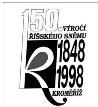
Oficiální logo oslav v roce 1998.

Zasedací pořádek Ústavodárného říšského sněmu v kroměřížském sněmovním sále.