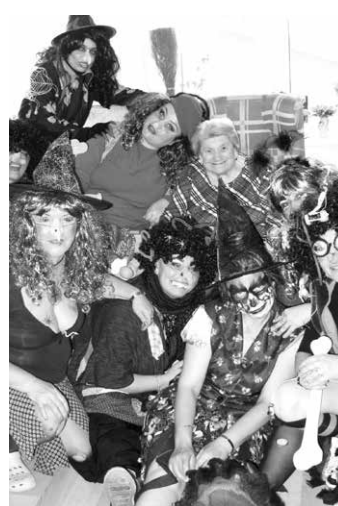
DZR Strom života

V našem zařízení si každoročně připomínáme původně pohanský zvyk, který dnes známe jako Pálení čarodějnic. Dříve lidé věřili, že právě Filipojakubská noc je nocí magickou. 2. května jsme u nás prožili kouzelné odpoledne ochucené magickými kouzly čarodějnic, přímo čarodějnými hrami a občerstvením téměř z ohně. Zlé síly jsme snad zažehnali, i když počasí nám zabránilo čarodějnici upálit. Opět se nám naskytla možnost pozorovat rozesmáté tváře našich uživatelů, což je darem pro nás všechny, kteří se péčí klientům věnujeme, a také zažeháním mnoha chmurných okamžiků, které život přináší.